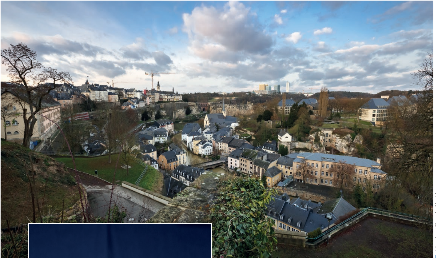
Նկարները՝ Մարտել Ֆելիք