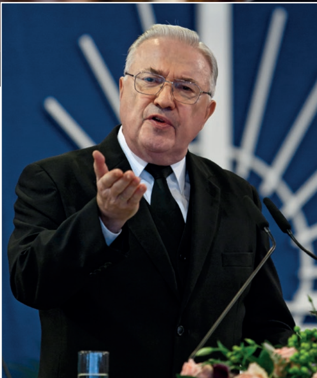
վերևում՝ խառը երգչախմբի երգչուհիները ձախում՝ առաքյալ Ռուդոլֆ Քայնցը /Ավստրիա/ ծառայելիս

Աստծո որդուն: Սակայն ձգտում են մերձավորի հանդեպ բարի լինել և Աստծոն ծառայել: Աստված նրանց օգտագործում է որպես գործիքներ բարին գործելու: Նրա համար հաճելի չէր լինի, եթե մենք նրանց չարժևորենք, նրանց արհամարհենք կամ անգամ հարձակվենք նրանց վրա: Սա իմ կողմից արված հայտնագործությունն չէ, սա գալիս է Տիրոջ խոսքից: