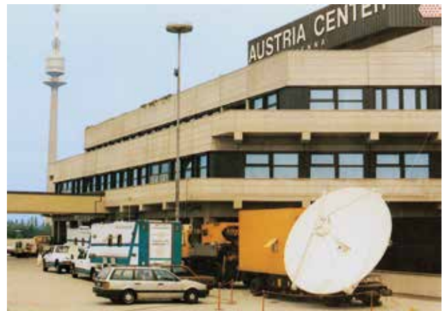
Carul de transmisie mobil în fața clădirii Austria-Center din Viena

Serviciul Divin de Rusalii al apostolului patriarh Richard Fehr, în prezența tuturor apostolilor din lume, a fost transmis pentru prima dată cu imagine și sunet prin satelit, din Austria-Center, Viena, în toată Europa, în aproximativ 900 de comunități; printre acestea, 70 de stații de recepție au fost în Elveția, trei în Ungaria, două în Austria și una în Iugoslavia.