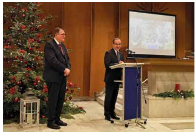
Apostolul patriarh le vorbește celor prezenți