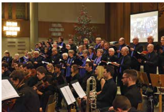
Corul interpretează un cântec