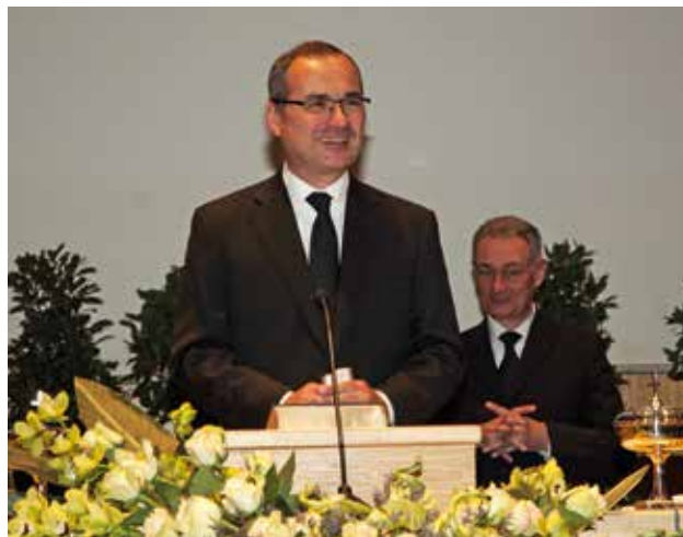
Apostolul patriarh le slujește confracților din Wels