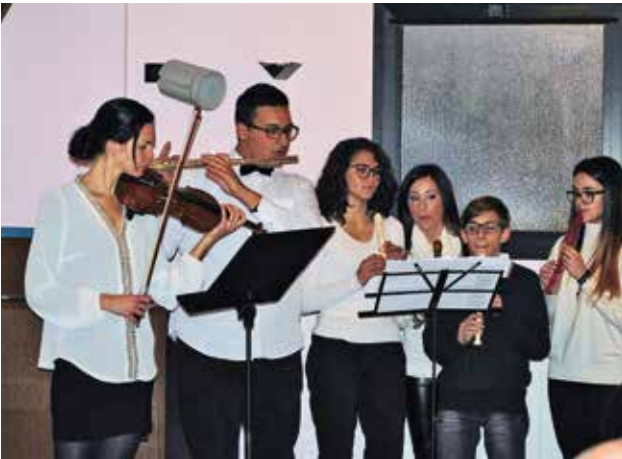
Acompaniament muzical al orchestrei