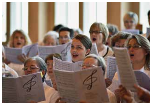
Cântecul de încheiere a fost interpretat de corul de copii împreună cu corul mixt