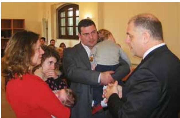
Episcopul Camenzind oferă unui copil sacramentul Sfântului Botez cu apă

Pentru prima dată de la numirea sa în funcție, episcopul Rolf Camenzind, a slujit pe data de 18 ianuarie 2015 în comunitatea Carrara (Italia). Ideea de bază a serviciului divin a fost constituită de cuvântul biblic din Luca 8,1 și 2. Episcopul a subliniat, printre altele, că Domnul, pregătirea pentru revenirea Lui trebuie să fie prezente în inimile fiecăruia dintre noi.