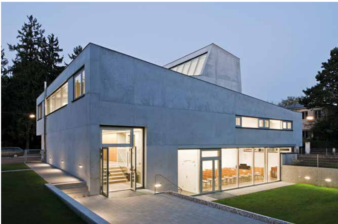
Spatele bisericii și grădina în timpul nopții