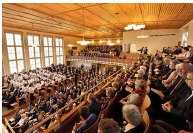
Comunitatea în timpul serviciului divin, văzută de sus