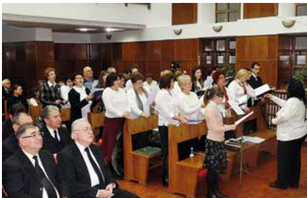
Aproximativ 300 de confrăți și oapeți au participat la Serviciul Divin