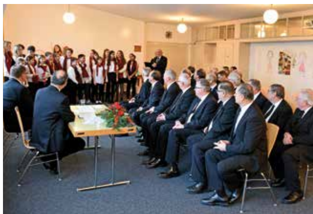
Corul de copii cântă în camera preoților pentru apostolul patriarh și însoțitorii lui