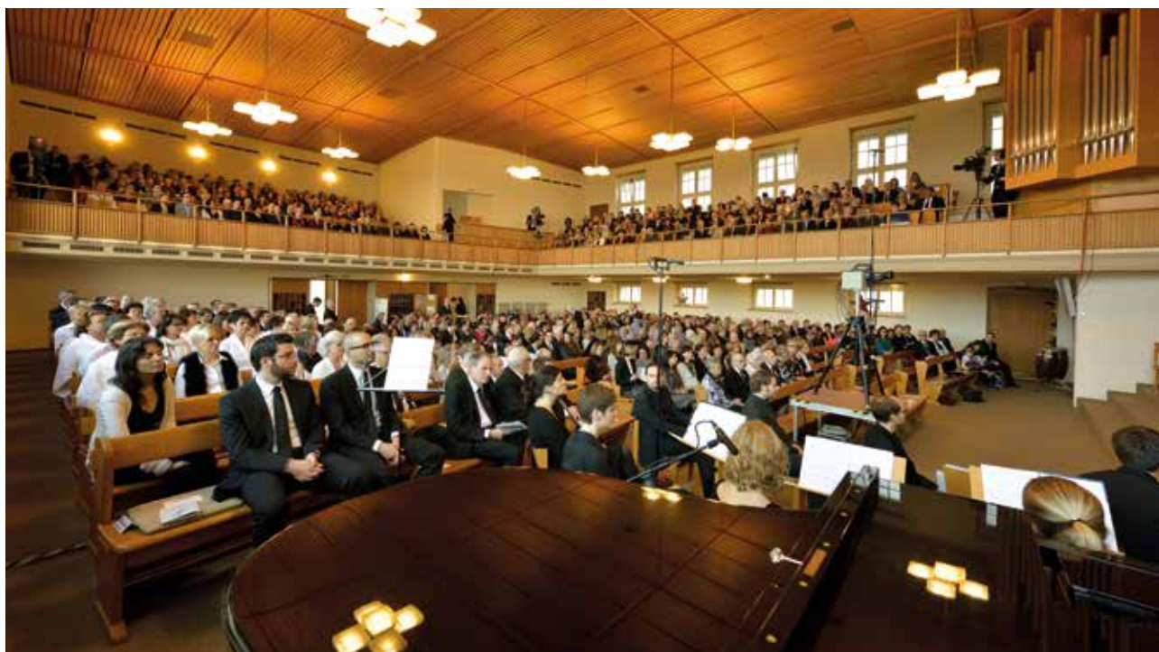
Comunitatea festivă în biserica Zürich-Wiedikon

Răbdarea lui Dumnezeu constituie o șansă de salvare și o perioadă de îndreptare, i-a spus apostolul patriarh comunității. El l-a citat apoi pe Iov: ”chiar dacă nu te am decât pe tine, totul