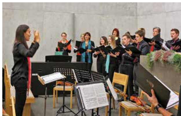
Concertul de inaugurare din biserica cea nouă

Datorită marelui interes al publicului față de noua biserică au fost organizate pe 15 și 16 octombrie 2014 două zile a ușilor deschise. Punctul culminant l-a reprezentat un concert de inaugurare desfășurat în ziua de sâmbătă 18 octombrie. Pe lângă aceasta, au mai avut loc diferite alte evenimente, printre care un serviciu divin pentru invitați, un concert de orgă și vizitări ale clădirii bisericii. În urma activității depuse de serviciul pentru relații publice, inaugurarea bisericii a avut răsunet în medii, iar interesul dovedit pentru Biserica Nouapostolică a produs în rândul nostru multă bucurie. Frații și surorile sunt bucuroși să aibă o nouă casă a lui Dumnezeu.