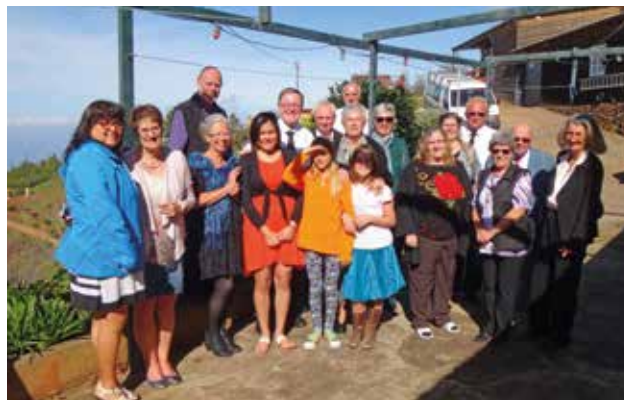
Surorile din comunitatea Las Tricias (La Palma)

Frații și surorile din Spania cântă de puțină vreme dintr-o carte nouă de cântece, cu aproape 300 de cântece. 200 dintre ele sunt specifice țării. 98 sunt traduceri dintr-o selecție internațională, care se regăsește de exemplu și în cărțile de cântece în germană și engleză. Cărțile noi au fost tipărite în Spania, însă modelul a fost preluat din Argentina, la fel și cartea tipărită pentru orgă.