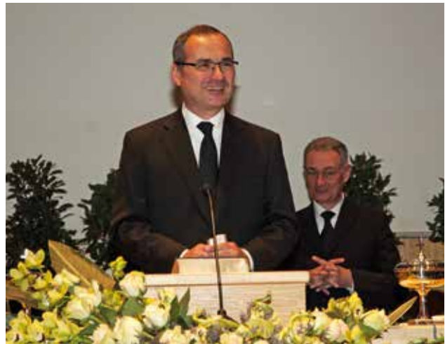
A főapostol szolgál a testvéreknek Wels dísztermében