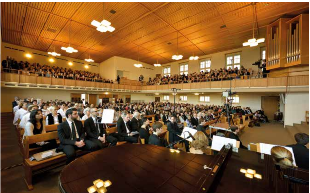
Az ünnepi gyülekezet Zürich-Wiedikon templomában

Isten türelmét a megváltás lehetőségének és a megtéréshez