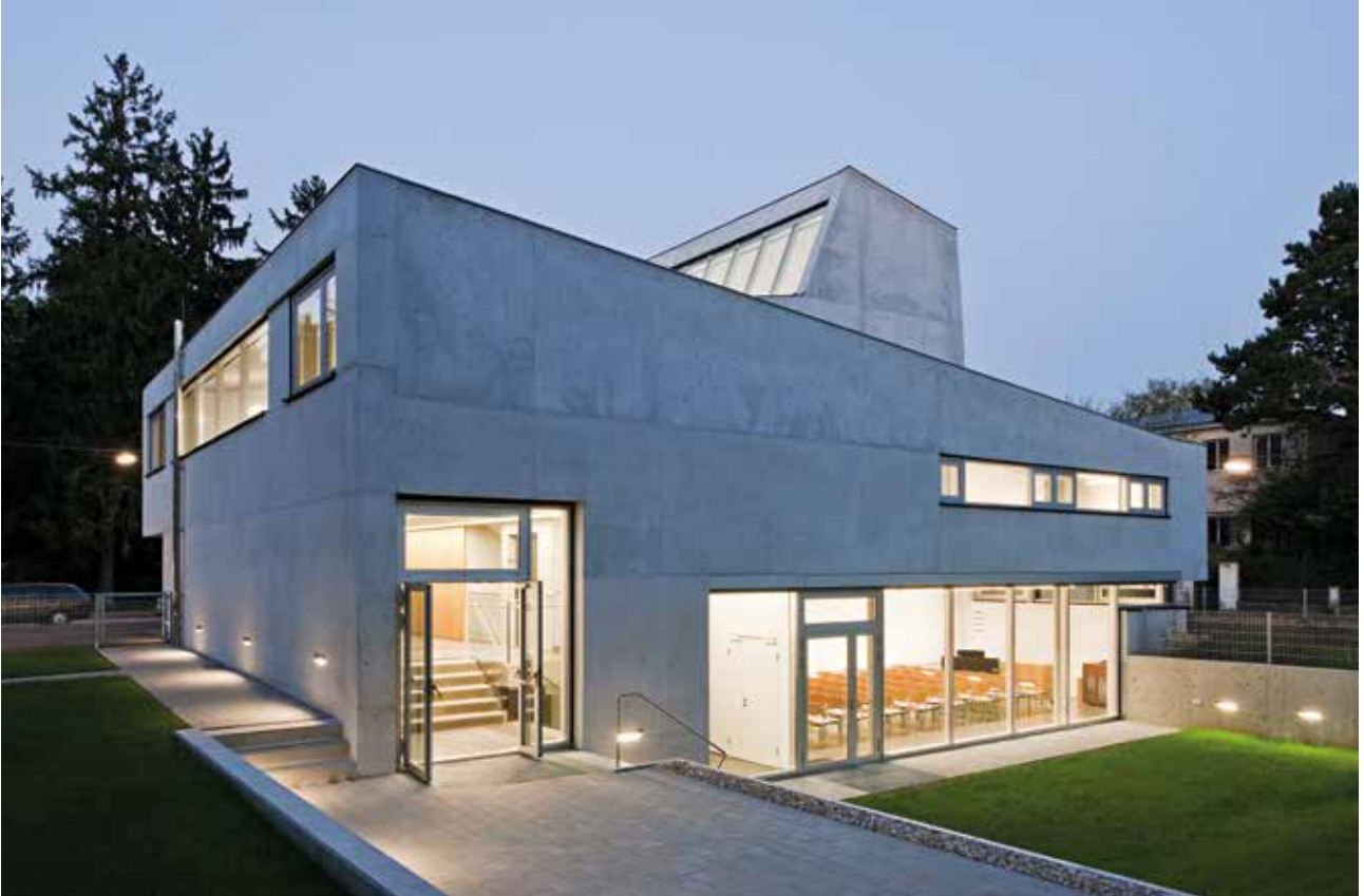
A templom hátsó homlokzata a kerttel éjszaka