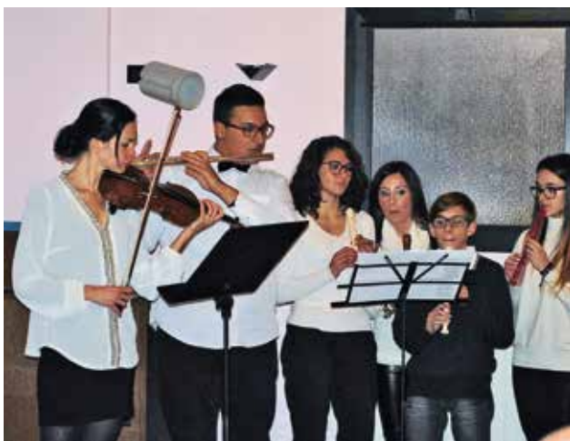
Zenekar biztosítja a zenei keretet