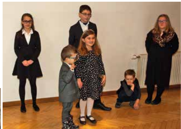
Gyerekek előadnak egy darabot