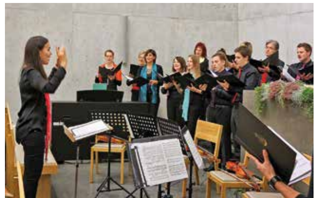
Az új templomban tartott felszentelő koncert

A nyilvánosság körében folytatott munka tekintetében nagy örömmel tölthet el bennünket a média élénk visszhangja és az Új Apostoli Egyház iránt tanúsított érdeklődése. A testvérek boldogok, hogy új templomot tudhatnak magukénak.