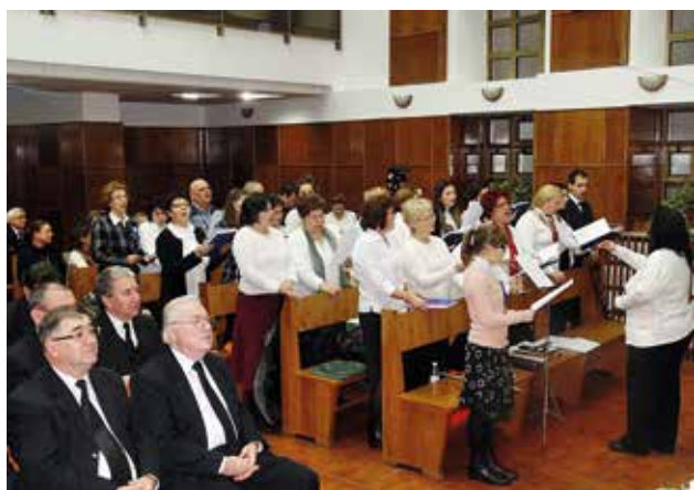
Kerekén 300 testvér és vendég vett részt az istentiszteleten