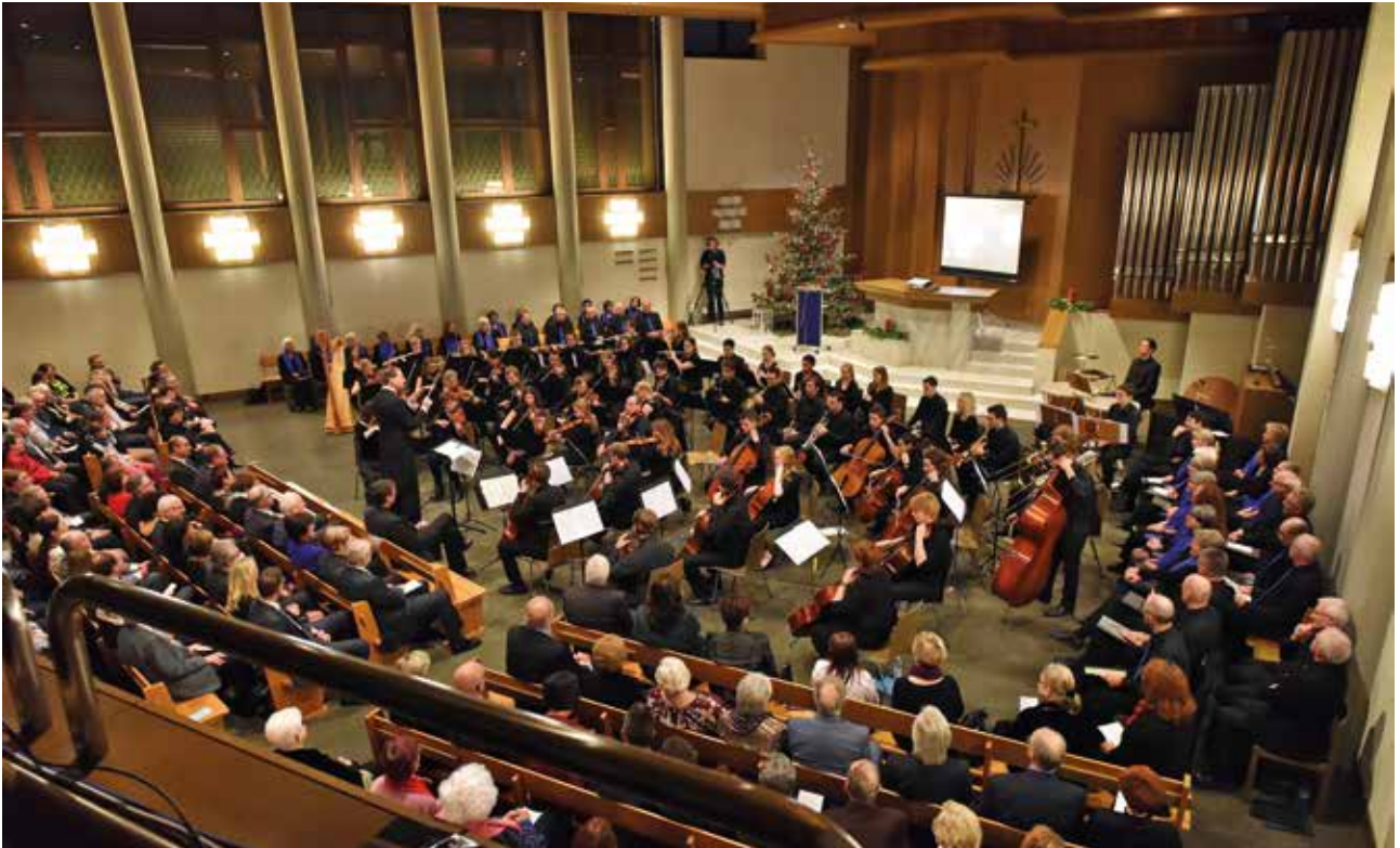
A Zürichsee-Kórus énekesei