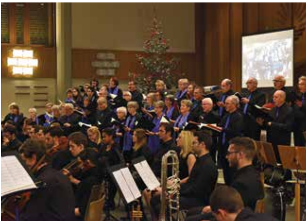
A kórus zenei előadása az istentiszteleten