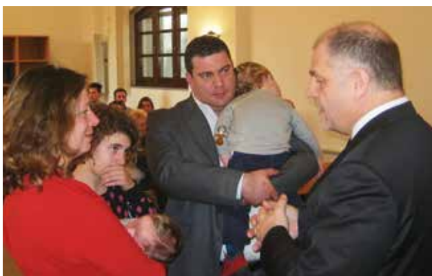
Camenzind püspök egy gyermeket részesített a szent vízkeresztiség szentségében

Tisztségre iktatását követően Rolf Camenzind püspök 2015. január 18-án a carrarai (Olaszország) gyülekezetben szolgált. Az istentisztelet Lukács 8, 1 és 2 verseire épült. Szolgálatában a püspök többek között rámutatott arra, hogy az Úr felkészít bennünket eljövételére, és mindannyiunkban éljen a vágy, hogy hallgassuk Isten igéjét.