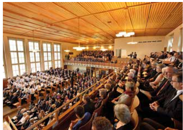
A gyülekezet az istentisztelet alatt a karzatról nézve