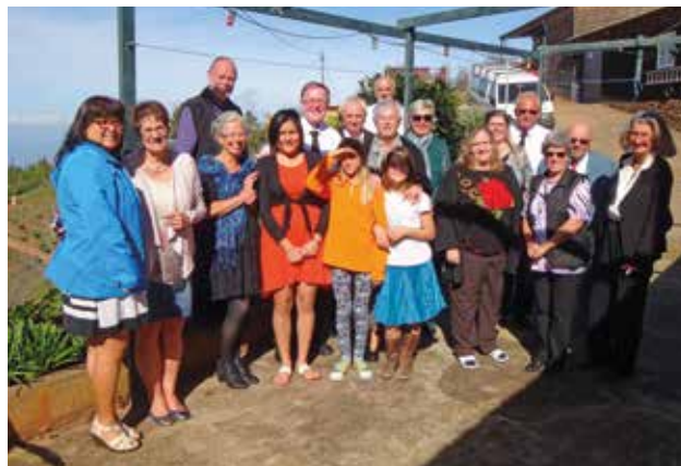
Testvérek Las Tricias gyülekezetéből (La Palma)

Spanyolországban a testvérek egy ideje az új, közel 300 éneket tartalmazó énekeskönyvből énekelnek. Az énekek közül 200 a hagyományos gyűjteményből való. 98 darab fordítás egy nemzetközi válogatásból, melyek például a német és az angol nyelvű énekeskönyvben is megtalálhatók. Az új énekeskönyvet ugyan Spanyolországban nyomtatták, a minta azonban Argentínából érkezett, akárcsak a nyomtatott orgonakönyvek.