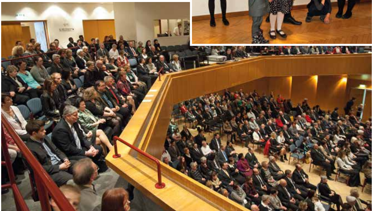
Az ünnepi gyülekezet