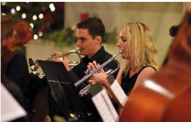
A fiatalok szimfonikus zenekar zenészei