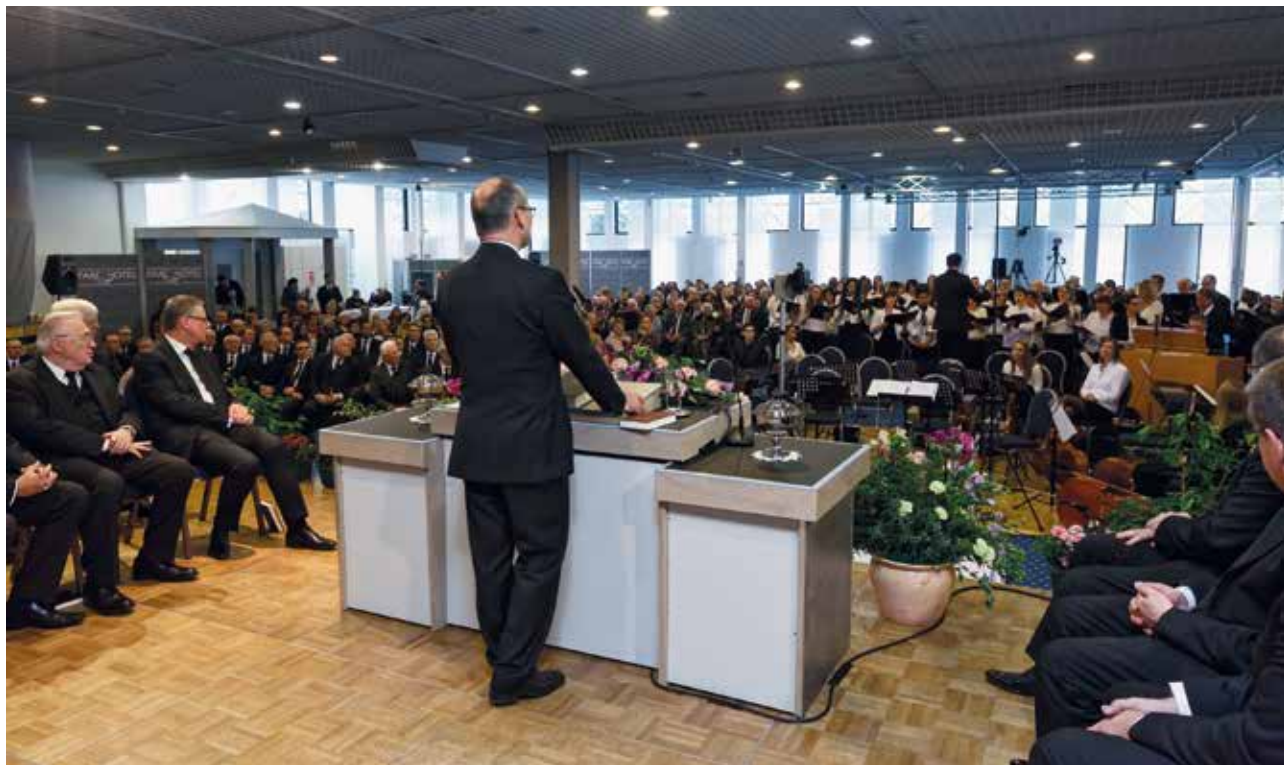
lent: vegyes kórus énekel az istentiszteleten