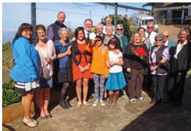
Hermanos de la comunidad Las Tricias (La Palma)

Un momento especial de gran emoción fue la celebración de la Santa Cena para difuntos en Fuerteventura, en la cual intercedió en oración para los miles de refugiados que en los últimos años perdieron su vida ahogados en el mar durante su travesía de África a Fuerteventura.