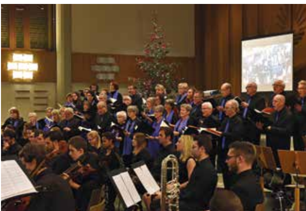
Presentación del cántico del coro