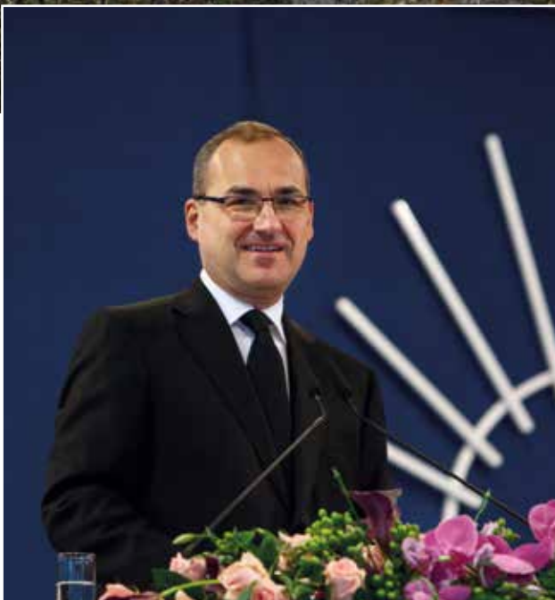
Servicio Divino del 11 de enero de 2015 en Luxemburgo