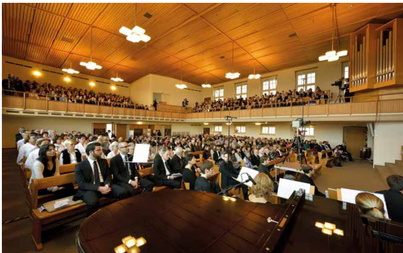
La comunidad festiva en la iglesia de Zúrich-Wiedikon