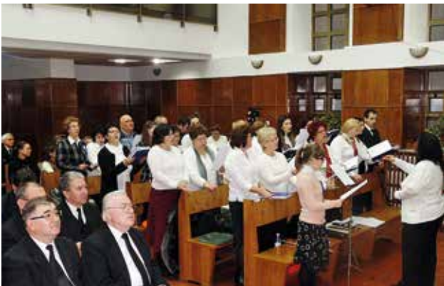
Unos 300 hermanos e invitados asistieron al Servicio Divino