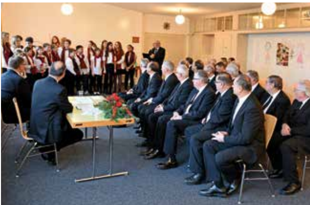
Un coro de niños cantó en la sala de cargos para el Apóstol Mayor y sus acompañantes