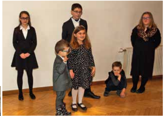
Los niños realizan una obra de teatro