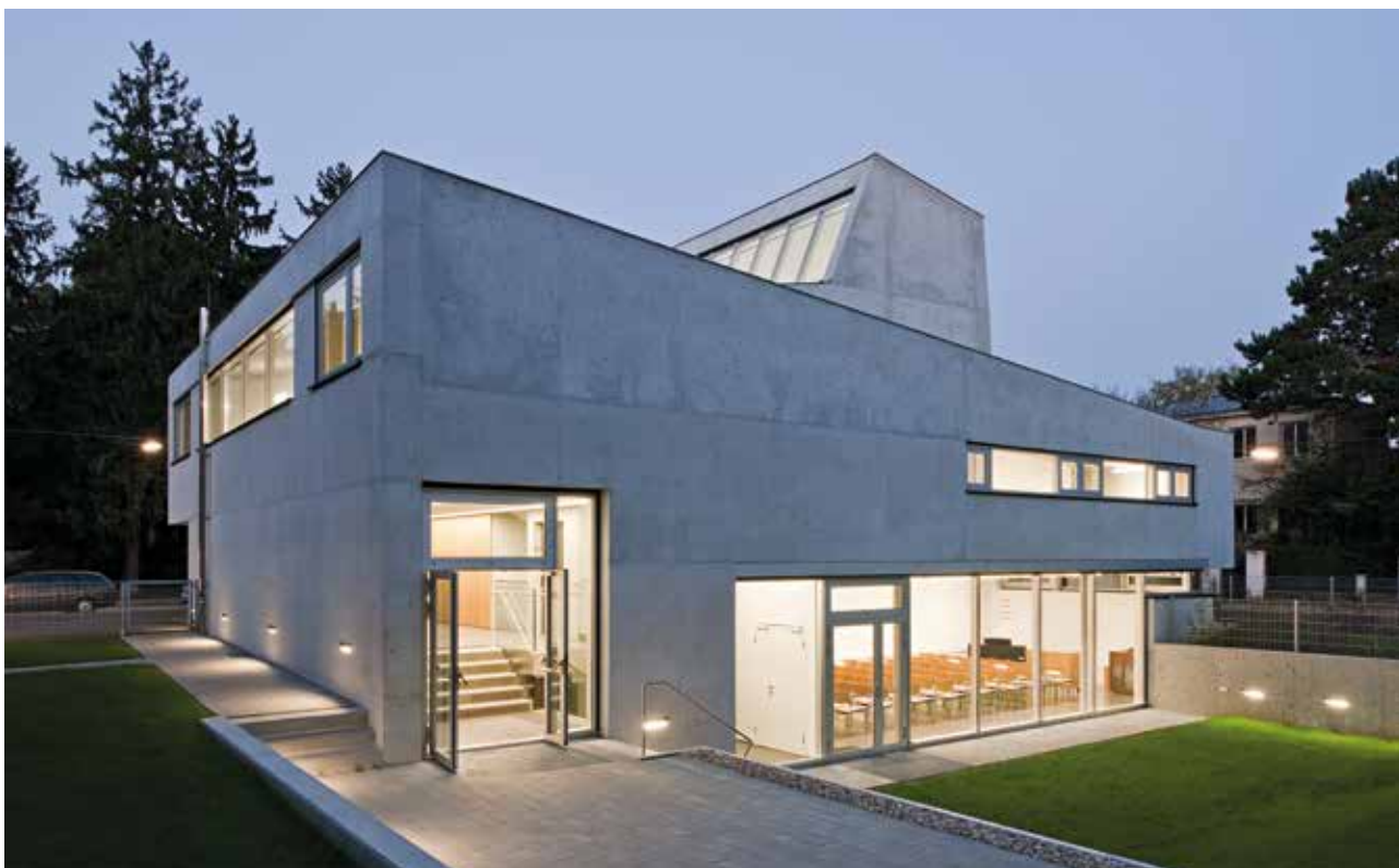
La fachada trasera de la iglesia con jardín de noche