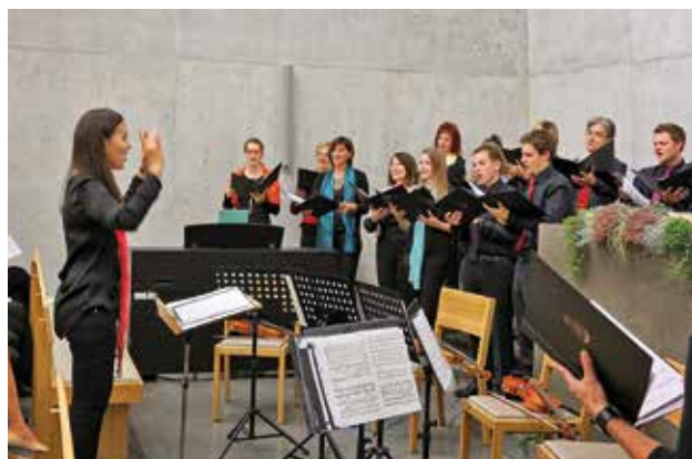
El concierto de inauguración de la nueva iglesia

forma de entreplantas hacia arriba y hacia abajo. La sala para la comunidad, con 75 asientos, tiene acceso directo al exterior en la planta baja. Pasando por una galería en el vestíbulo de dos plantas se llega a la galería de la iglesia con 30 asientos más. El interés del público en este edificio es grande. Por ello se realizaron dos días de puertas abiertas, el 15 y el 16 de octubre de 2014, y como punto culminante, un concierto de inauguración el sábado, 18 de octubre de 2014. A parte de ello se realizaron muchos más eventos, entre otros un Servicio Divino para invitados, un concierto de órgano y diversas visitas guiadas. Desde la perspectiva de las relaciones públicas podemos estar contentos por el gran eco en los medios y el interés mostrado en la Iglesia Nueva Apostólica. Los hermanos en la fe tienen gran alegría por tener una casa de Dios nueva.