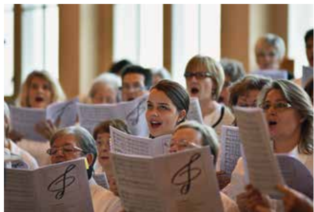
El cántico final, interpretado por el coro de niños y coro mixto