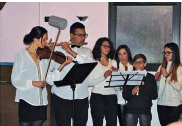
Acompañamiento musical de la orquesta

El salón de la iglesia de Marsico Nuovo estaba ocupado en la mañana del domingo, 1 de febrero de 2015, hasta el último asiento. El Apóstol de Distrito Markus Fehlbaum, acompañado por el Apóstol Jürg Zbinden y el Obispo Rolf Camenzind, sirvió a los hermanos del distrito Sur de Italia con un pasaje bíblico de Isaías 43:21: "... Este pueblo he creado para mí, mis alabanzas publicará."