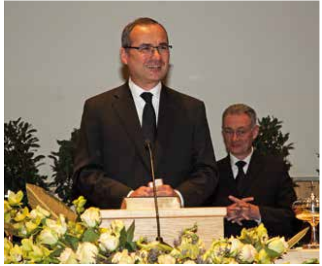
El Apóstol Mayor sirve a los hermanos en el salón festivo

Con el Apóstol Mayor Schneider vinieron a Wels además, junto al Apóstol de Distrito Markus Fehlbaum, todos los Apóstoles del área de Apóstol de Distrito de Suiza y los Apóstoles Volker Kühnle (sur de Alemania) y Peter Klene (Holanda).