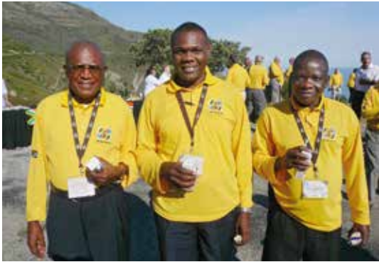
Abajo: Impresiones de la reunión de Apóstoles en Angola