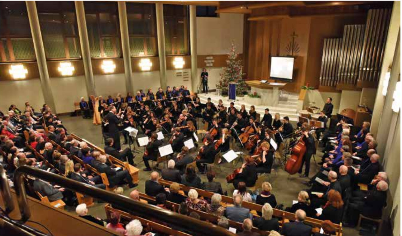
Cantores del coro „Zürichsee“