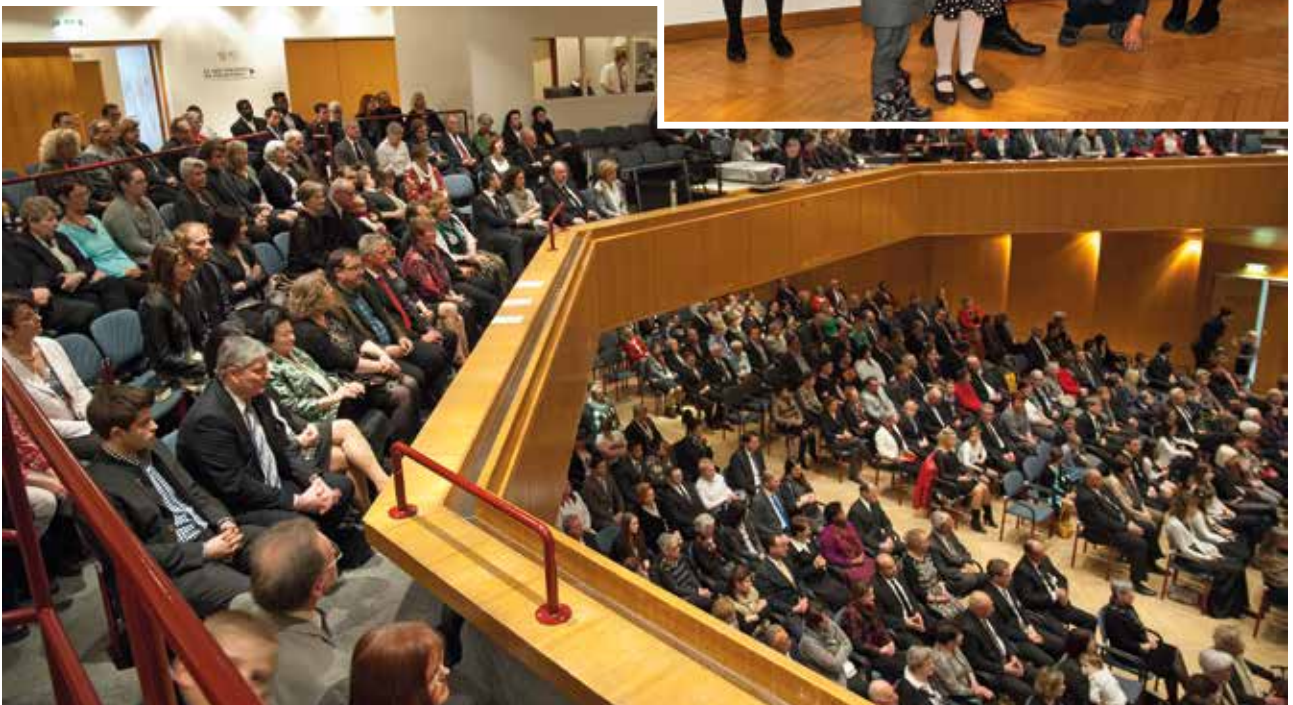
La comunidad festiva