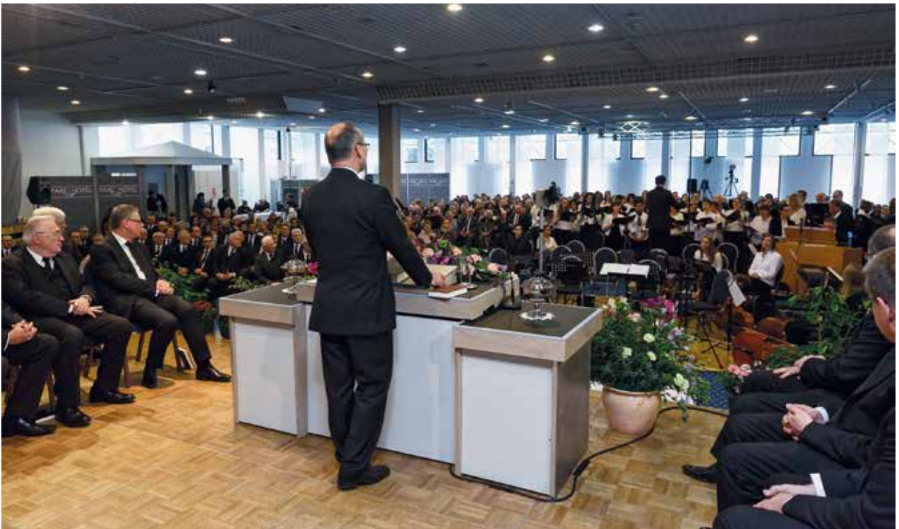
Abajo: Durante el Servicio Divino canta el coro mixto