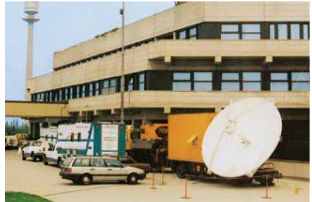
La unidad móvil ante el Austria-Center en Viena

Con esta finalidad, el "KonzertChor SüdHessen" viajó, a principios de enero, por cuarta vez a Roma, dio dos conciertos, participó activamente en una misa en San Pedro y vivió un Servicio Divino el domingo, 4 de enero de 2015 en la comunidad nuevoapostólica de Roma. El Apóstol Jürg Zbinden sirvió a los hermanos con un pasaje bíblico del Apocalipsis 19:17. Pudo ordenar a dos Presbíteros y dispensar el don del Espíritu Santo a un alma. Tras el Servicio Divino hubo oportunidad para cuidar contactos personales en una reunión agradable.