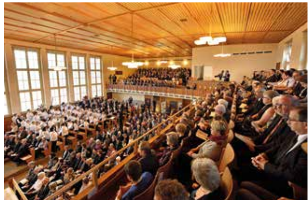
La comunidad durante el Servicio Divino vista desde la galería