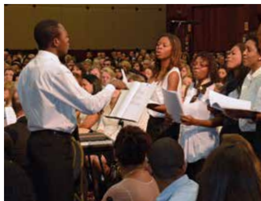
Izq., arriba: el coro y la orquesta contribuyen al Servicio Divino, recreándolo musicalmente

importante porque sería el primer encuentro con el Apóstol Mayor Jean-Luc Schneider. Al Servicio Divino del domingo que se realizó en un hotel habían sido invitados los hermanos en la fe de las ocho comunidades del estado federado de San Pablo y de los estados federados vecinos.