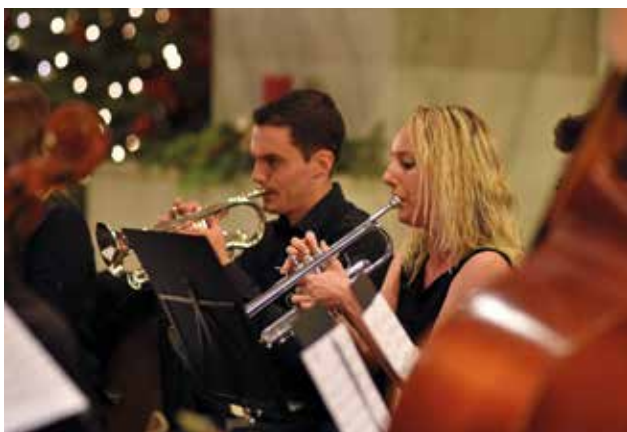
Hudebníci z orchestru „Symfonie mladých“