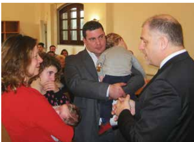
Biskup Camenzind uděluje dítěti svátost Svatého křtu vodou

Poprvé po svém jmenování do úřadu sloužil biskup Rolf Camenzind bohoslužbu v neděli dne 18. ledna 2015 v obci Carrara (Itálie). Základem této bohoslužby byla slova z Lukášova evangelia 8,1 a 2. Biskup ve svém sloužení poukázal mimo jiné na to, že Pán nás připravuje na den jeho opětovného návratu a že přání, slyšet slovo Boží, by měl mít každý z nás.