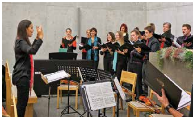
Koncert u příležitosti vysvěcení nového kostela

Zájem veřejnosti o novou církevní budovu je velký. Proto se 15. a 16. října 2014 uskutečnily Dny otevřených dveří a jako vyvrcholení v sobotu 18. října 2014 koncert u příležitosti vysvěcení kostela. Kromě toho proběhly různé další akce, mimo jiné bohoslužba pro hosty, varhanní koncert a různé prohlídky. Z pohledu public relations se můžeme radovat z pěkné odezvy v médiích a ze zájmu o Novoapostolskou církev. Pro sourozence je pěkné, že mají nový Boží dům.