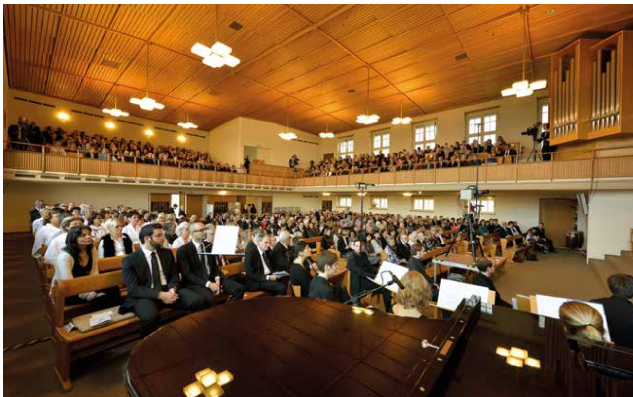
Slavnostní obec v kostele Curych-Wiedikon

Na Boží trpělivost je třeba nahlížet jako na možnost spásy a na čas k obrácení, upozornil kmenový apoštol obec. Citoval