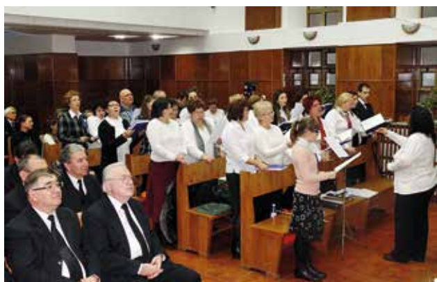
Bohoslužby se zúčastnilo na 300 sourozenců a hostů