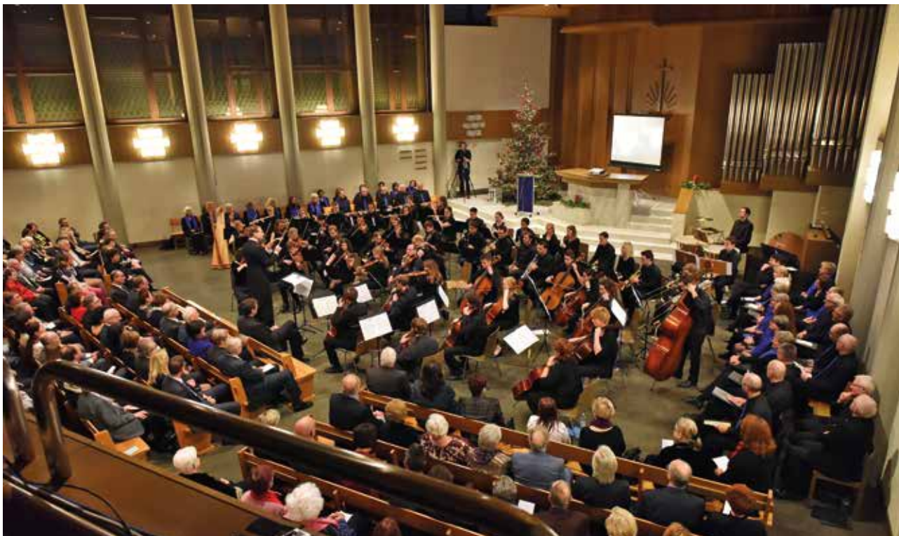
Sbor z oblasti Curyšského jezera nadchl posluchače