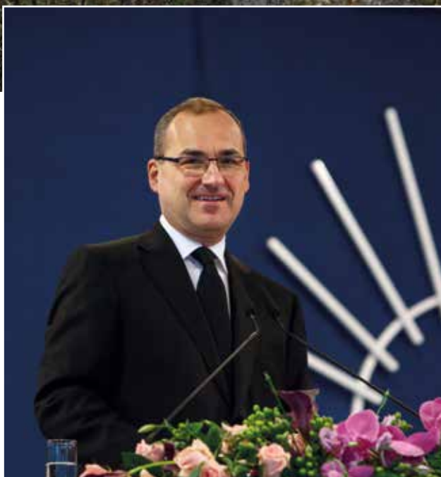
Bohoslužba dne 11. ledna 2015 v Lucemburku