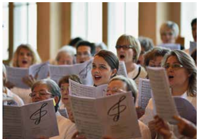
Závěrečná píseň, přednesená dětským a smíšeným sbo- rem