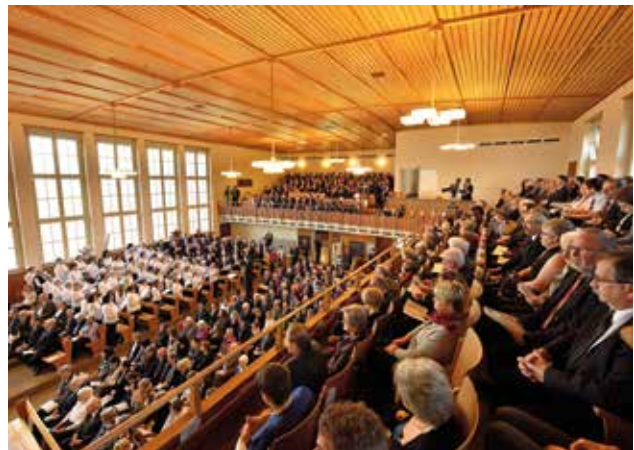
Obec během bohoslužby pohledem z galerie