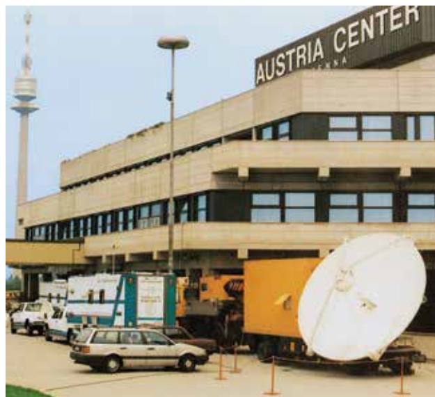
Přenosový vůz před Austria-Center ve Vídni