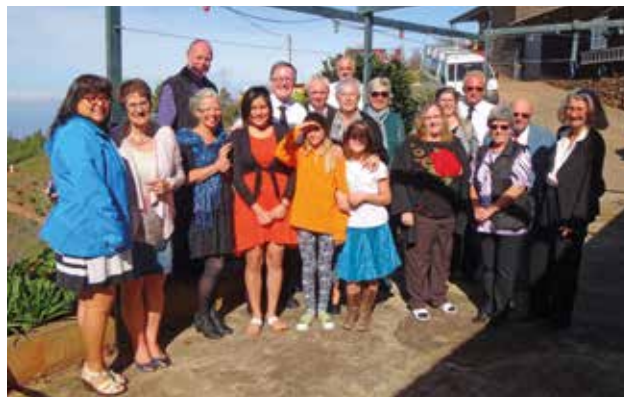
Bratři a sestry z obce Las Tricias (La Palma)

Sestry a bratři ve Španělsku nedávno zpívali z nového zpěvníku, který obsahuje téměř 300 písní. Z toho asi 200 písní jsou písně tradiční. 98 písní jsou překlady z mezinárodního výběru, které je možné nalézt například v německém i anglickém zpěvníku. Nové zpěvníky se sice tiskly ve Španělsku, nicméně předloha pochází z Argentiny, stejně jako varhanní knihy.