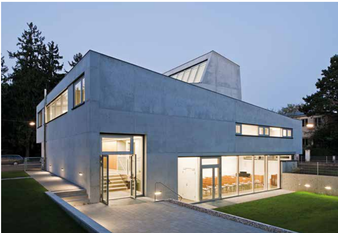
Zadní část kostela se zahradou v noci