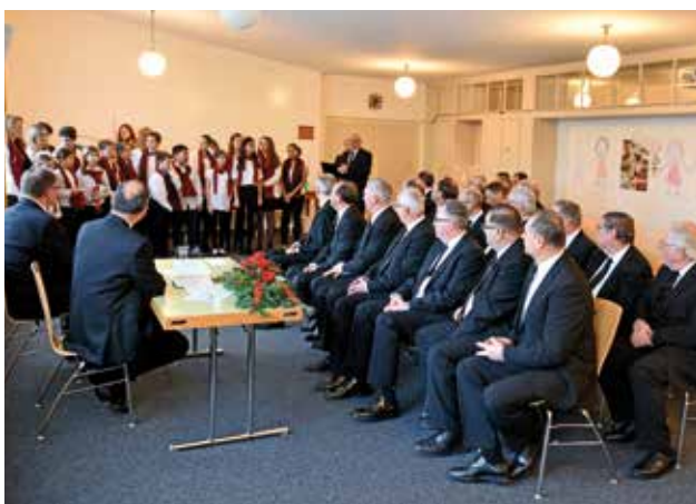
Детски хор пее в стаята за сановници за главния апостол и придружаващите го.