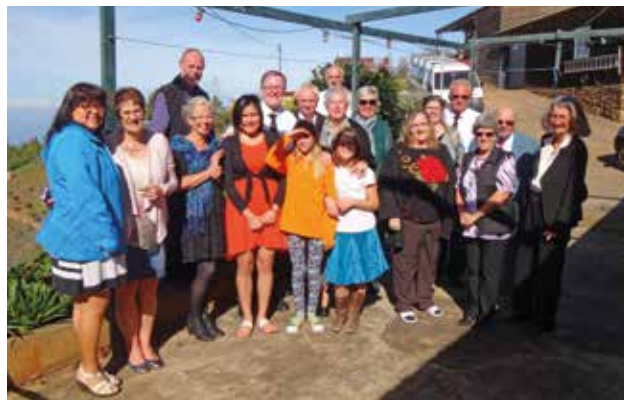
Братя и сестри от енорията Лас Трисиас (Ла Палма)

Отскоро братята и сестрите в Испания пеят от нова Песнопойка с близо 300 песни. От тях 200 са от традиционния песенен репертоар. 98 са преводи от международната Песнопойка, такива, които се срещат например и в немските) и английски Песнопойки. Новите Песнопойки са били отпечатани в Испания, обаче проектът както и Песнопойките за орган, са от Аржентина.