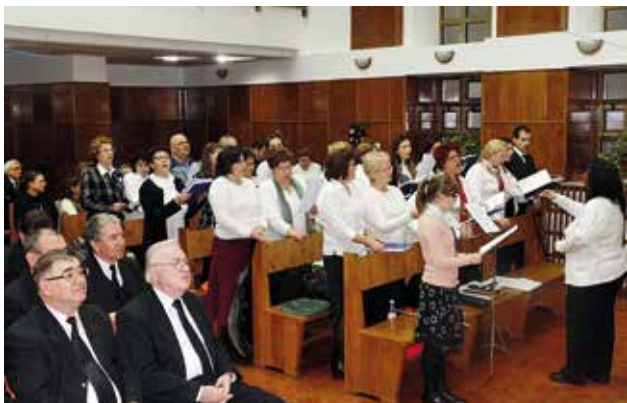
Около 300 братя и сестри и гости участвали в това богослужение