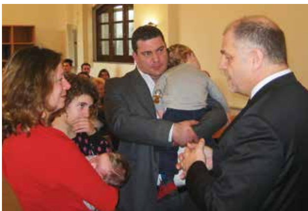
Епископ Камензинд дари едно дете с тайнството на Светото Кръщение с вода

За първи път след ръкополагането му, епископ Ролф Камензинд служил на 18. януари 2015 г. в енория Карара (Италия). За основа на богослужението служило словото от Лука 8, 1 и 2. По време на службата епископът обърнал внимание и на това, че Господ ни подготвя за деня на Неговото идване и че желанието да се чуе Божието словото би трябвало да е присъщо за всекиго.