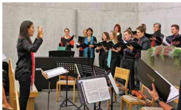
Концертът по повод освещаването в новата църква

Интересът на обществеността към нова църковна сграда е голям. Затова на 15. и 16. октомври 2014 г. се проведеха Дни на отворените врати и като кулминация концерт в събота, 18. октомври 2014 г. по случай освещаването. Освен това се състояха различни други инициативи, между другото богослужение за гости, концерт с орган и различни развешдания. Имайки предвид извършеното от обществеността можем да се радваме на оживеното медийно ехо и интерес към Новоапостолската Църква. За братята е добре да имат един нов Божи дом.