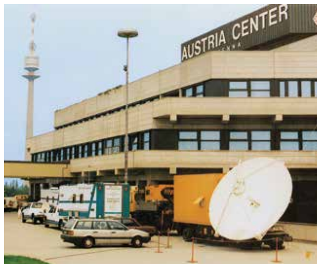
Подвижната телевизионна станция пред Austria-Center във Виена