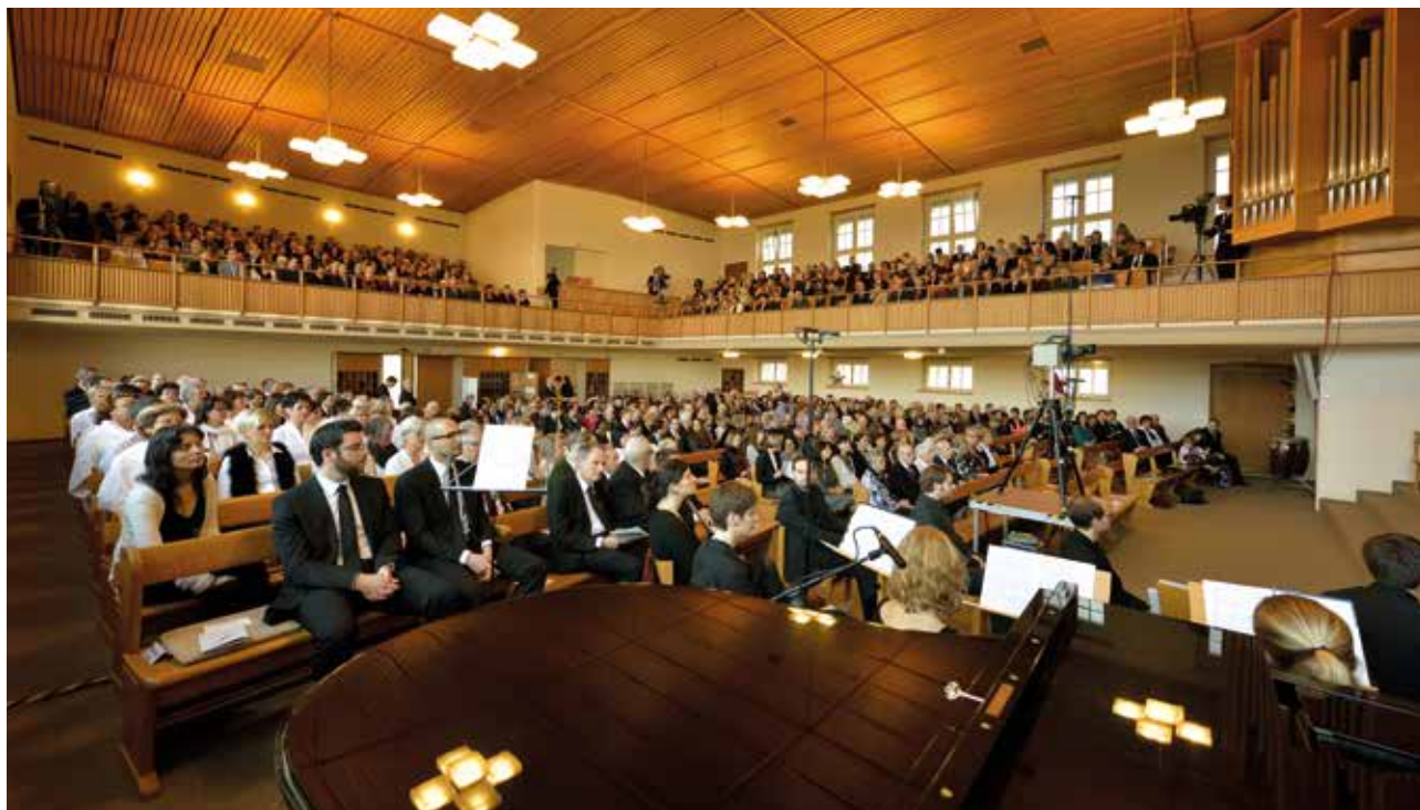
Празничната енория в църквата Цюрих-Виедикон

Главният апостол споделил с енорията: На Божието търпение би трябвало да се гледа като възможност за спасение и като време за завръщане. Той цитирал и Хиоб: „Ако имам само Тебе, тогава всичко е добре” – един знак за зрялост. И: „Господ се нуждае от примери”, също така и в днешно време.