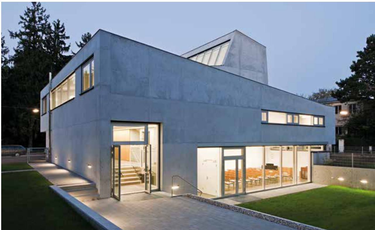
Задната страна на църквата с градинското пространство нощем