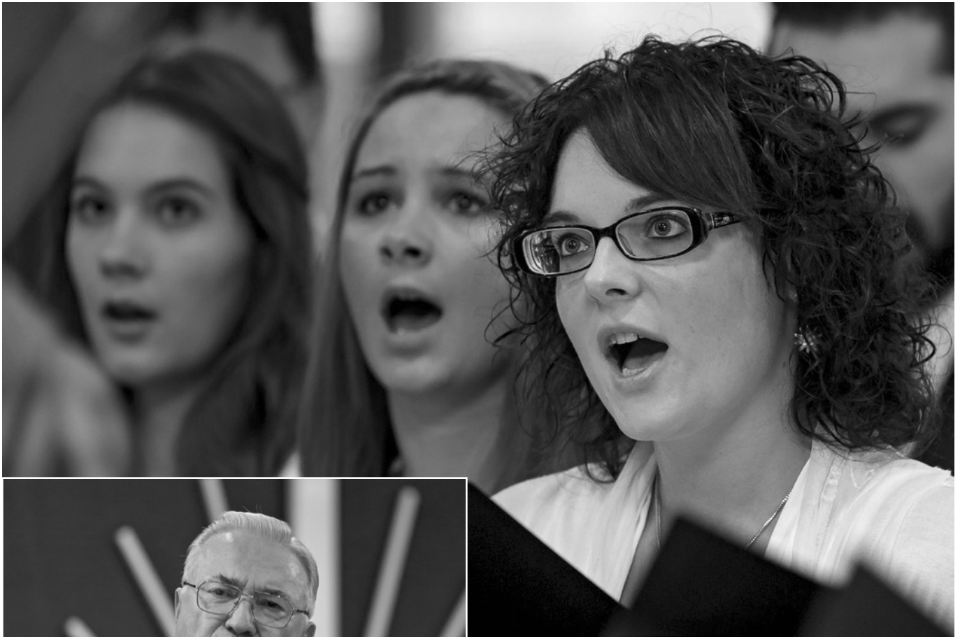
Pjevačice mješovitog zbora