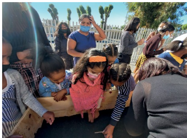
Τα παιδιά του Κέιπ Τάουν (Νότια Αφρική) κάνουν την άνοιξη να εισέλθει στον κήπο της εκκλησίας

της Εκκλησίας «Ελάτε να ψάλλουμε μαζί» ( Stimmt mit ein ), μαθαίνουν ιστορίες φωνητικής εκπαίδευσης και κατασκευής οργάνων, πράγματα τα οποία, στη συνέχεια ενσωματώνουν. Η μουσική είναι μια σημαντική πτυχή στην θρησκευτική εκπαίδευση, υποστηρίζει την ανάπτυξη της προσωπικότητας και προάγει την κοινωνία.