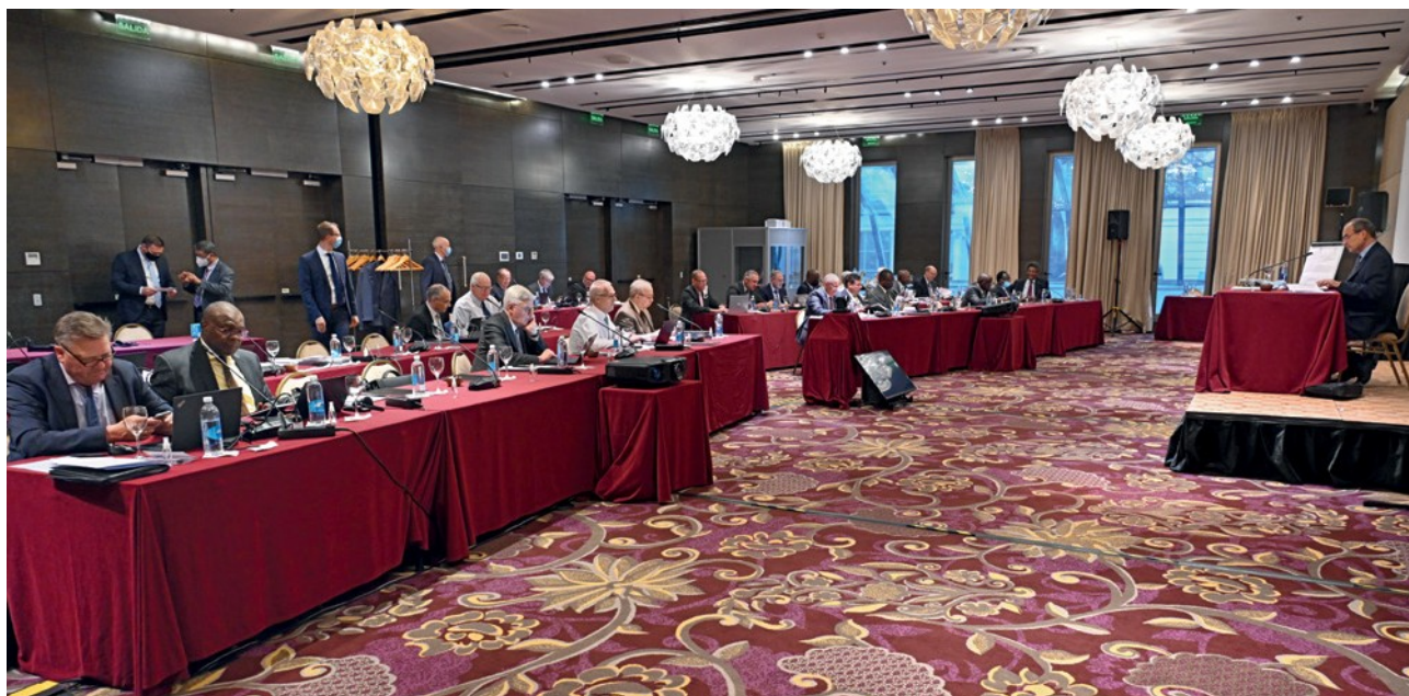
Η φρεσκάδα του κλιματιστικού δεν επηρέασε την ατμόσφαιρα

«Εκφράζω την μεγάλη μου ευγνωμοσύνη για αυτή την απόφαση», ομολόγησε ο Πρωταπόστολος μετά το πέρας της ψηφοφορίας. Ήταν κάτι που τον απασχολούσε εδώ και πολύ καιρό: Επιθυμούσε να μοιραστεί την ηγεσία του στην Εκκλησία, η οποία συνδέεται με την χειροτονία του ως Πρωταποστόλου, με ένα εκλεγμένο Διοικητικό Συμβούλιο, κυρίως και ειδικά για οικονομικά θέματα.