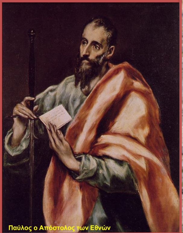
Παύλος ο Απόστολος των Εθνών