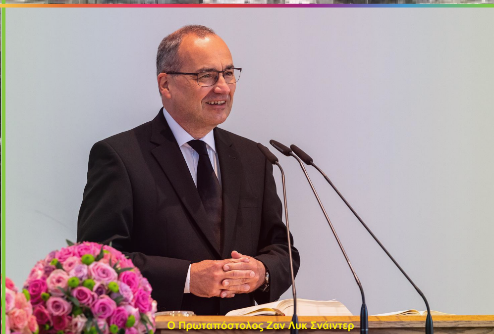
Ο Πρωταπόστολος Ζαν Λυκ Σνάιντερ