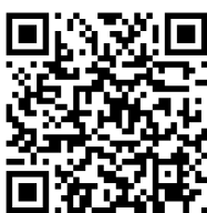
Φωτόδεντρο: Τα ταξίδια του Αποστόλου Παύλου