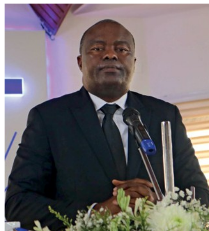
Ο αναπληρωτής Περιφέρειας Τσίτσι Τσισεκέντι

Εγκαθίδρυση μιας προσωπικής σχέσης: «Ο καθένας θα όφειλε να υψώνει ο ίδιος τα μάτια προς το φίδι. Η σωτηρία μας εξαρτάται από την προσωπική μας σχέση με τον Ιησού Χριστό. Κανείς δεν μπορεί να πιστεύει στην θέση μας· οφείλουμε να πιστεύουμε. Κανείς δεν μπορεί να εμπιστευτεί, να υπακούει αντί για εμάς· οφείλουμε να εμπιστευόμαστε, να υπακούμε. Η σχέση μας με τον Θεό δεν θα έπρεπε να εξαρτάται από τις σκέψεις, τις απόψεις ή τη συμπεριφορά ενός άλλου προσώπου. Δεν πρέπει να επηρεαζόμαστε από το πως συμπεριφέρονται, μιλούν ή ενεργούν οι άλλοι. Πρόκειται για μια προσωπική σχέση».