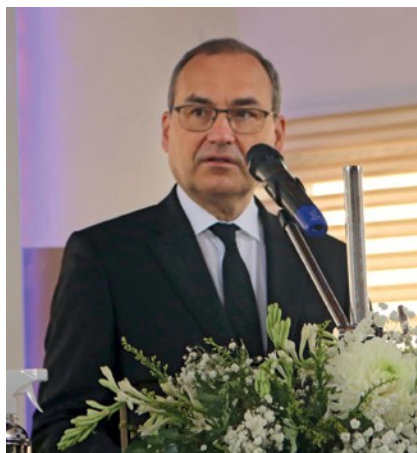
Ο Πρωταπίσκοπος Ζαν Λυκ Σνάνιτερ