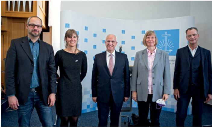
Εκπρόσωποι του Συμβουλίου Χριστιανικών Εκκλησιών

διάσημος ειδικός στις θρησκευτικές επιστήμες και αναγνωρισμένος ειδικός στην αποστολική σκηνή στην Ευρώπη, συμφώνησε με αυτή την ιδέα λέγοντας: «Η Νεοαποστολική Εκκλησία έχει γίνει θεολογικά κατάλληλη για Οικουμενισμό».