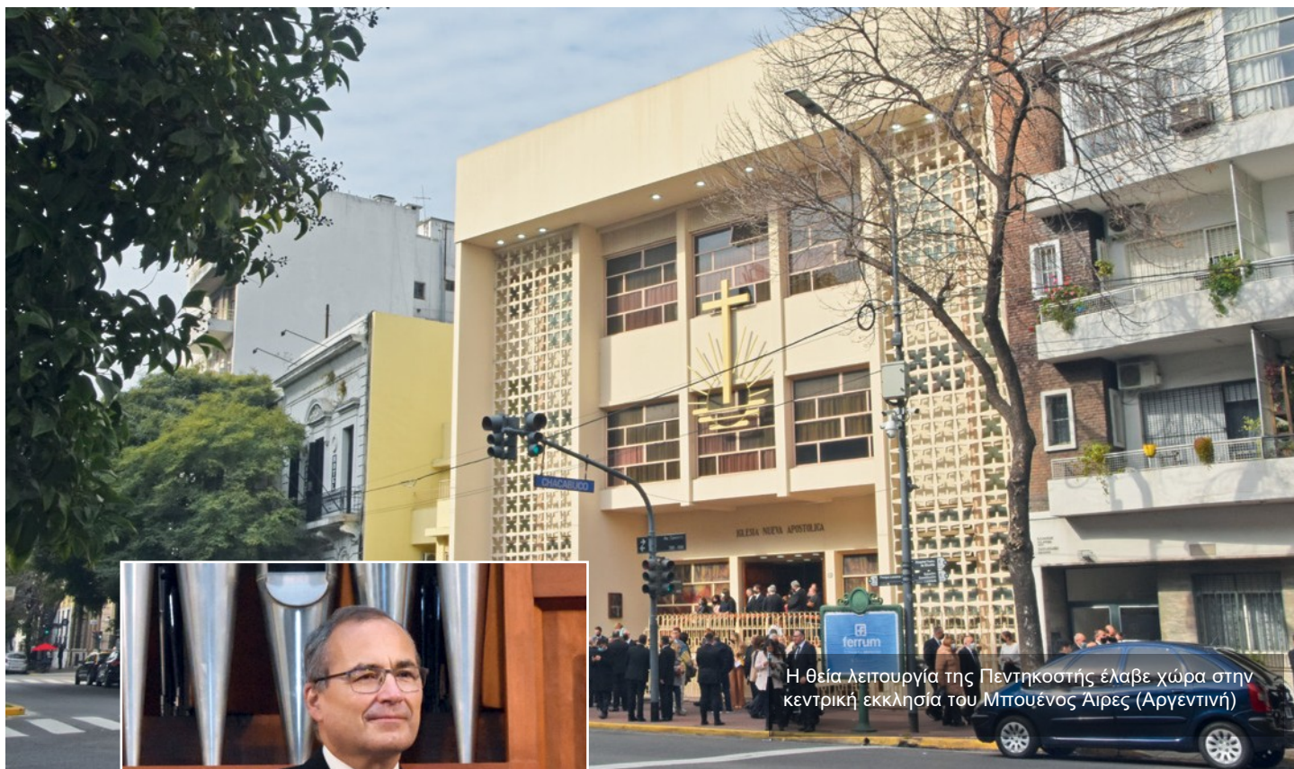
Η θεία λειτουργία της Πεντηκοστής έλαβε χώρα στην κεντρική εκκλησία του Μπουένος Άιρες (Αργεντινή)