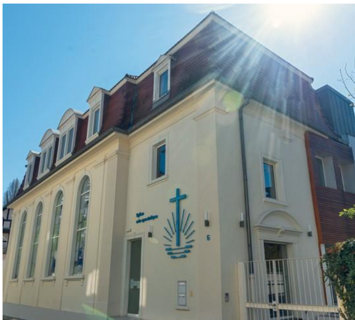
Οι αδελφοί και οι αδελφές της Αργεντινής επωφεληθήκαν από την μετάδοση της θείας λειτουργίας, από την εκκλησία του Στρασβούργου

τις θλίψεις, παρά τις ασθένειες ή τις μεγάλες οικονομικές δυσκολίες, παρά την βία και την εγκληματικότητα, παραμένουν πιστοί στον Κύριο. «Θα επιθυμούσα να το πω ξεκάθαρα: Όλα αυτά, τα θεωρώ με μεγάλο θαυμασμό και μεγάλο σεβασμό».