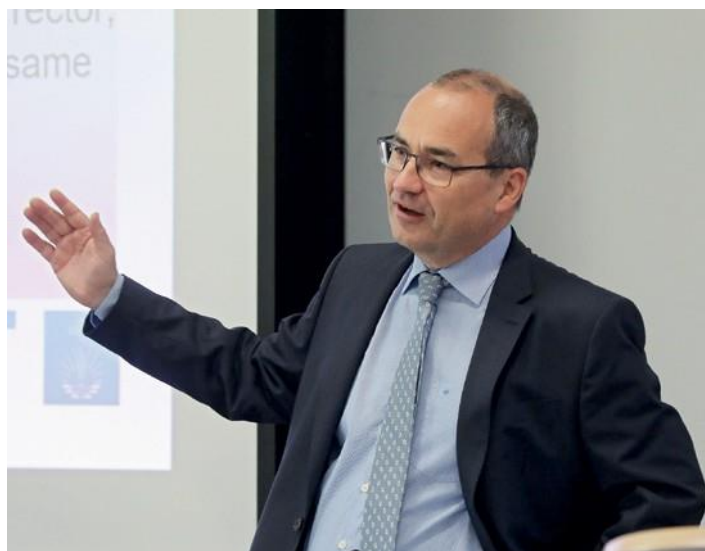
Οι Απόστολοι Περιφέρειας συζητούν με τον Πρωταπόστολο σχετικά με το θέμα της χειροτονίας των γυναικών