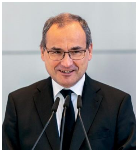
Ο Πρωταπόστολος Ζαν Λυκ Σνάνιτερ τέλεσε την θεία λειτουργία στο Κάιζερσλάουτερν