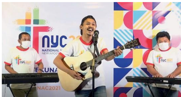
Παρά τον εικονικό χαρακτήρα των ημερών νεολαίας της Ινδονησίας, δεν έλειψαν καθόλου, η χαρά και το χιούμορ