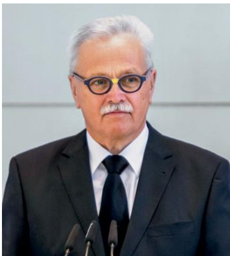
Ο επίσκοπος Φρίντιμπερντ Κρούιτς προέτρεψε τους αδελφούς και τις αδελφές να χρησιμοποιούμε τον χρόνο μας για να δοξάζουμε τον Ιησού Χριστό