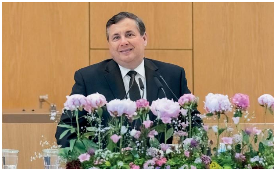
Ομιλητές: Ο Απόστολος Περιφέρειας Μάικλ Ντέπνερ/ Λαϊκή Δημοκρατία του Δυτικού Κογκό (αριστερά) και ο Απόστολος Περιφέρειας Λέοναρντ Ρ. Κολμπ/Η.Π.Α. (δεξιά)