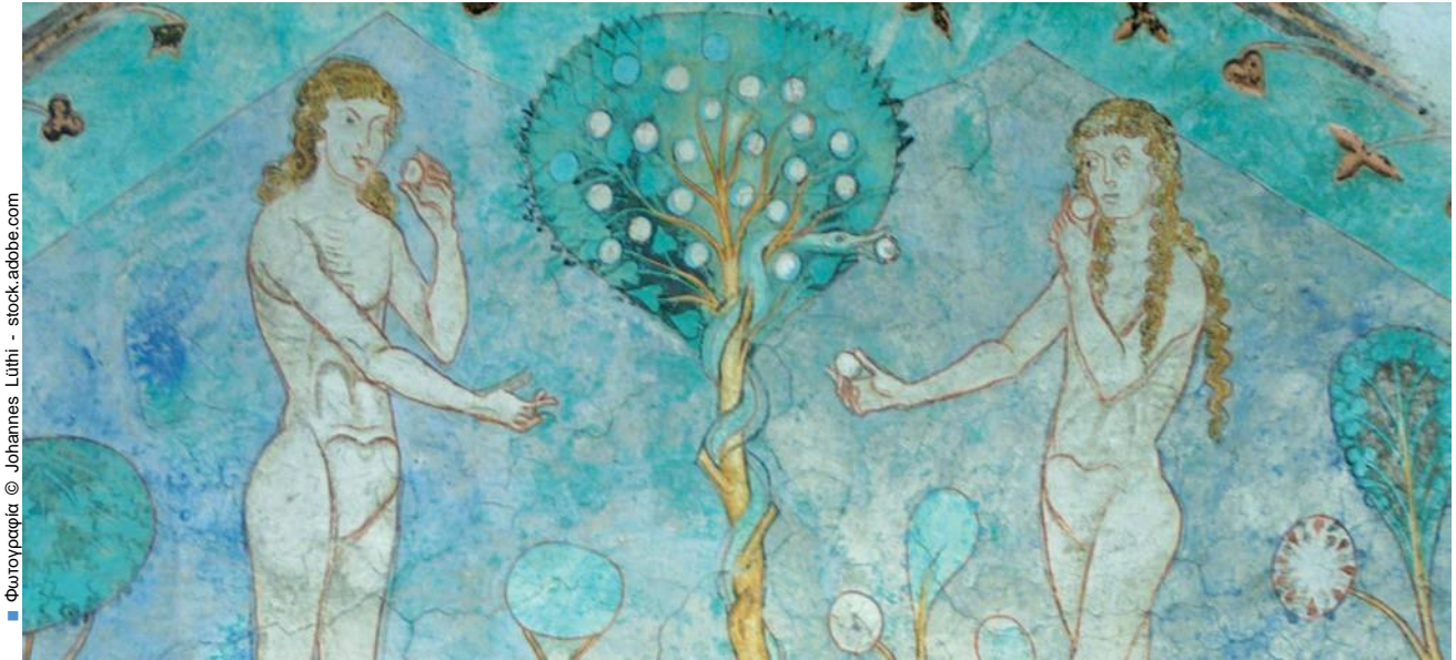
■ Φωτογραφία © Johannes Lüthi - stock.adobe.com