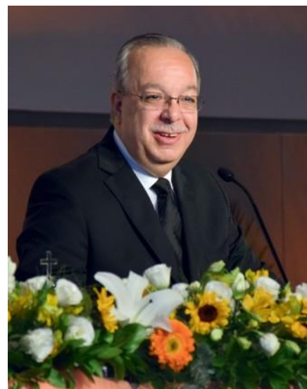
Ο Απόστολος Περιφέρειας Ενρίκε Μίνιο

να αναζητούμε ψυχές που θα μπορούσαν να λάβουν την Αγία Σφράγιση. Έτσι, καταλαβαίνουμε λίγο καλύτερα τα λόγια: «Έλα, επειδή όλα είναι ήδη έτοιμα!» – Έλα! Ο Ιησούς δεν σε περιμένει! Δεν εξαρτάται από εσένα. Αλλά σε αγαπά. Έλα τώρα!