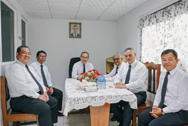
Ο Απόστολος Σαμουήλ Τανζατικνό, ο Απόστολος Περιφέρειας Ένπι Ισονουγκρόχο, ο Πρωταπόστολος Ζαν Λυκ Σνάιντερ, ο αναπληρωτής Απόστολος Περιφέρειας Δαυίδ Ντεβαραζ και ο Απόστολος Φρεντ Βολφ.