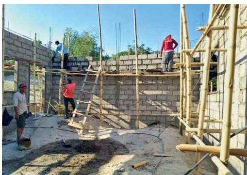
Κατασκευή με την βοήθεια του «NAC SEA Relief Fund» (Νεοαποστολική Εκκλησία της Νοτιοανατολικής Ασίας)