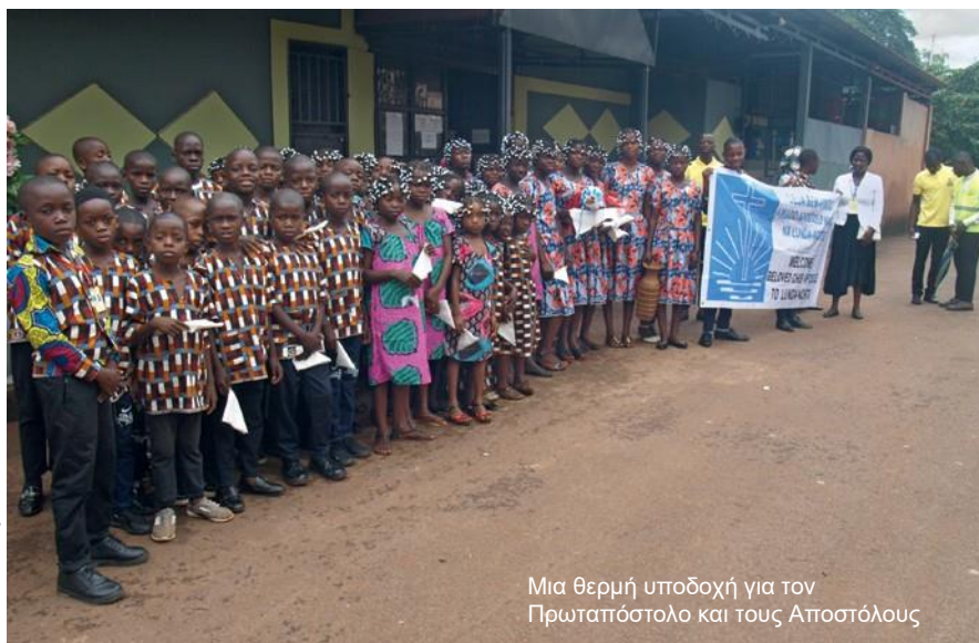
Μια θερμή υποδοχή για τον Πρωταπόστολο και τους Αποστόλους