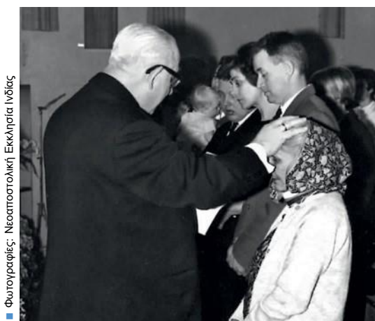
■ Φωτογραφίες: Νεοαποστολική Εκκλησία Ινδίας

Όλα άρχισαν με μία μόνο γυναίκα, η οποία ασπάστηκε τη Νεοαποστολική πίστη κατά τη διάρκεια ενός ταξιδιού της στη Δανία. Πριν 50 χρόνια, η αδελφή μας αυτή στην πίστη στην Ινδία, δεν κράτησε την πίστη της για τον εαυτό της, αλλά, μίλησε για τον Ιησού και τους ζωντανούς Αποστόλους, στον περίγυρό της. Παρά τα πολλά εμπόδια, σχεδόν 45 000 Νεοαποστολικοί χριστιανοί ζουν σήμερα στην Ινδία.