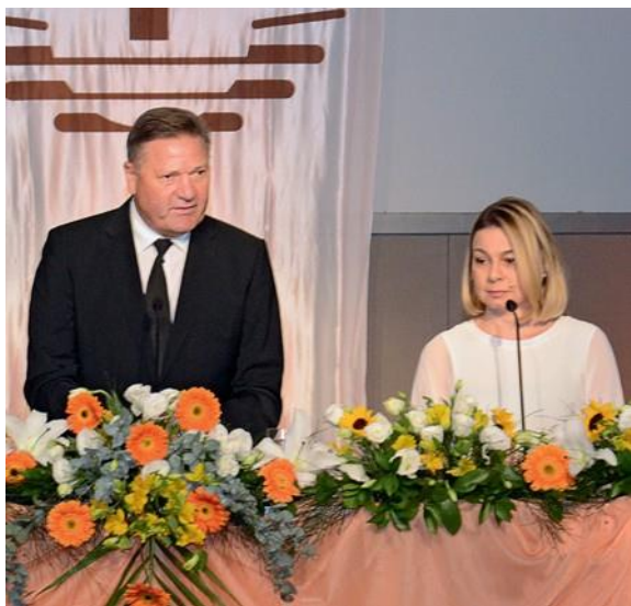
Ο Απόστολος Περιφέρειας Ράινερ Στορκ (Δυτική Γερμανία)