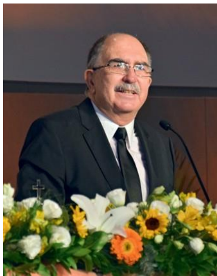
Ο Απόστολος Περιφέρειας Ραούλ Μόντες ντε Όκα