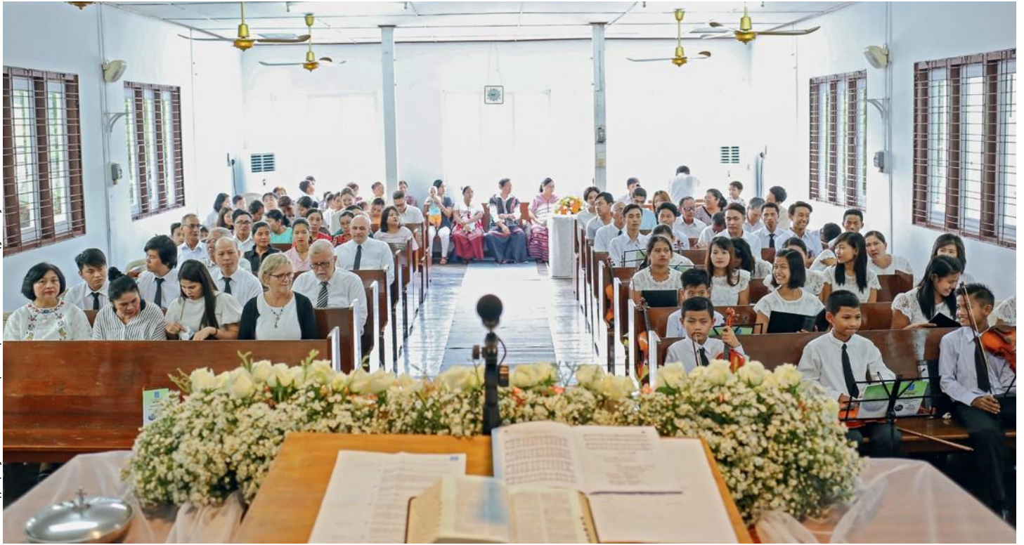
■ Φωτογραφίες: Νεοαποστολική Εκκλησία Νοτιοανατολικής Ασίας

298 πιστοί συναθροίστηκαν στην κοινότητα του Λαγίνγκ Σαχ, στο Καλάιμιο (Laying Suh, à Kalaymyo), για να συμμετάσχουν στην θεία λειτουργία.