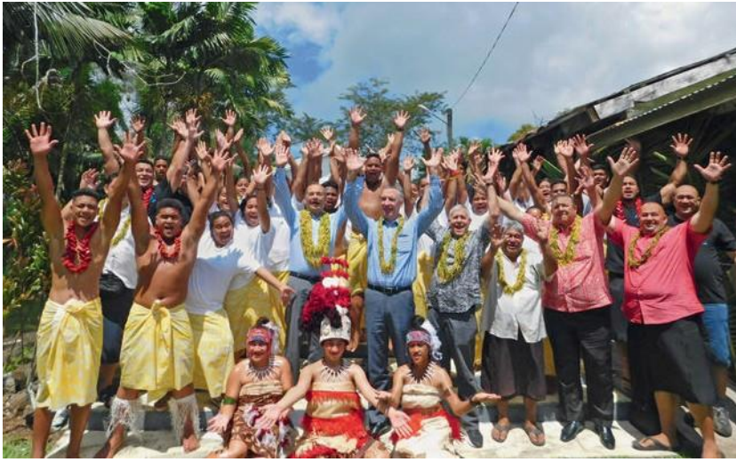
Ο Πρωταπόστολος Ζαν Λυκ Σνάιντερ ταξίδεψε για δέκα ημέρες στην Ωκεανία

Δύο θείες λειτουργίες την ίδια ημέρα, ταυτόχρονα, σε δύο διαφορετικά μέρη: Ο Πρωταπόστολος δεν χρειάζεται να επαναλαμβάνεται για το σκοπό αυτό, χρειάζεται μόνο να ταξιδέψει πίσω στον χρόνο. Αυτό είναι κάτι εντελώς φυσιολογικό... για τους αδελφούς υπηρεσίας του Νοτίου Ειρηνικού.