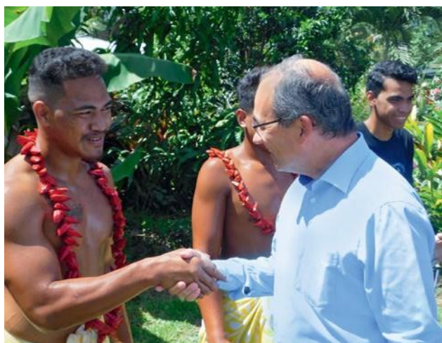
Το πρόγραμμα περιλάμβανε επίσης συναντήσεις με επισκόπους και Αποστόλους