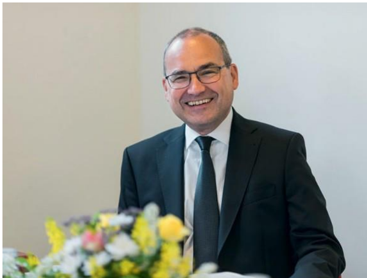
Η θεία λειτουργία που τελέστηκε από τον Πρωταπόστολο Σνάιντερ, μεταδόθηκε στη Δανία, την Φινλανδία, τη Νορβηγία και τη Σουηδία.

είναι πλέον επίκαιρη. « Εάν κάποιος με αγαπά, θα κρατήσει τον λόγο μου και ο Πατέρας μου θα τον αγαπήσει· ερχόμαστε κοντά του για να παραμείνουμε μαζί του, στην κατοικία του », είπε ο Ιησούς. Ενεργώντας με τον τρόπο αυτό, σίγουρα δεν γινόμαστε απαραίτητα πλουσιότεροι και πιο αποτελεσματικοί, αλλά ζούμε την εγγύτητα του Θεού!