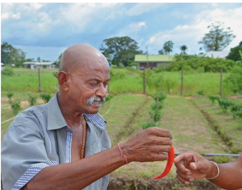
Ένας ειδικός στο τσίλι, επιθεωρεί τη συγκομιδή

Επιπλέον, το ίδρυμα «Stichting Corantijn» ανακαίνισε ένα κυβερνητικό κτίριο στην πόλη, το οποίο βρίσκεται ακριβώς δίπλα στην εκκλησία μας και κατάφερε να αναπτύξει ένα ενδιαφέρον σχέδιο χρήσης, μαζί με τον πρεσβύτερο του χωριού: Στο κτίριο αυτού, του οποίου η επιφάνεια είναι 2000 τετραγωνικά μέτρα, εγκαταστάθηκαν μέχρι το τέλος του 2018, ένας παιδικός σταθμός, δύο χώροι συνάντησης για τη νεολαία, με μια βιβλιοθήκη και μια αίθουσα με υπολογιστές, δύο διαμερίσματα για τους δασκάλους του χωριού και μια αίθουσα αποξήρανσης για το τσίλι.