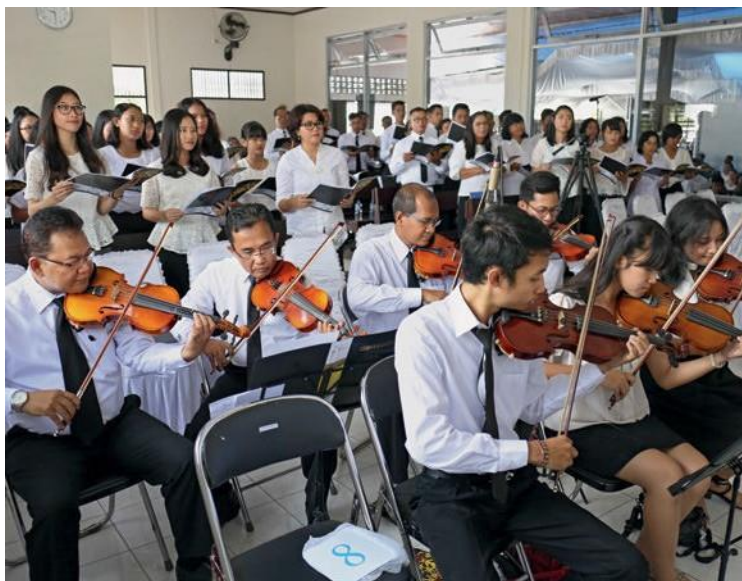
Plus de 300 frères et sœurs ont assisté au service divin célébré par l'apôtre-patriarche Schneider. Le matin, ils l'ont accueilli de manière traditionnelle par une cérémonie