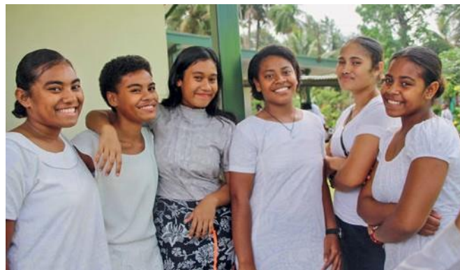
Ο Πρωταπόστολος επισκέφτηκε αδελφούς και αδελφές σε τέσσερις χώρες και τέλεσε πέντε θείες λειτουργίες