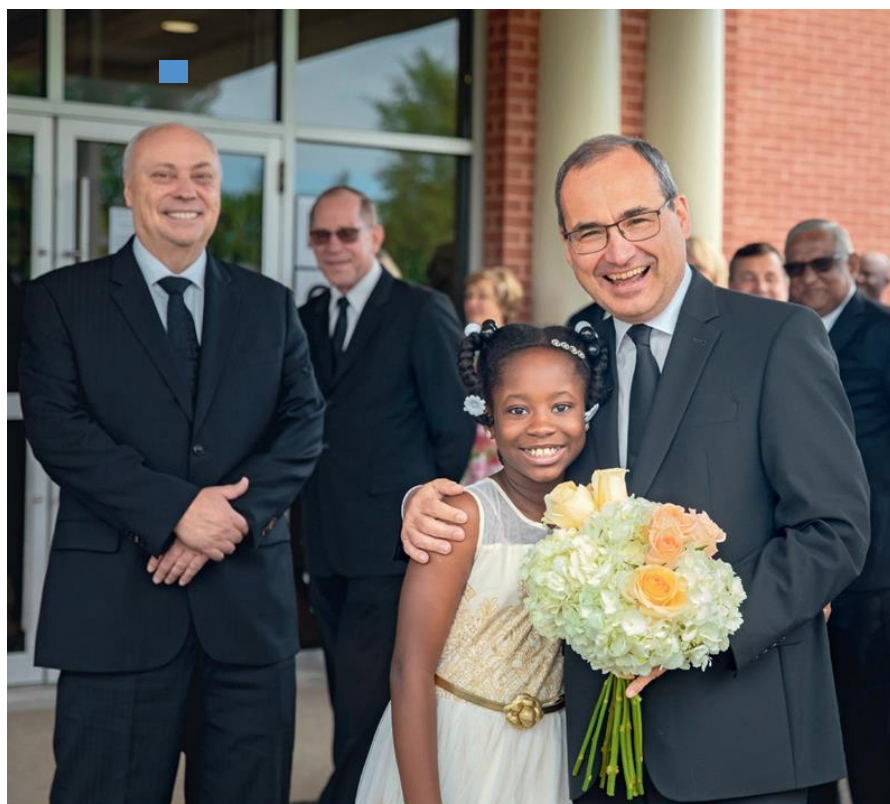
■ Φωτογραφία εξωφύλλου: Oliver Rütten ■ Φωτογραφία επάνω: Ν.Ε. Καναδά

ΝΕΟΑΠΟΣΤΟΛΙΚΗ ΕΚΚΛΗΣΙΑ ΑΘΗΝΑΣ Δημητρίου Ράλλη 47, ΜΑΡΟΥΣΙ Τηλ.: 210 6142 071 - 697 9936 165 Θείες λειτουργίες: Κυριακή 10:00 π.μ. Τετάρτη 19:30 μ.μ. Είστε όλοι ευπρόσδεκτοι