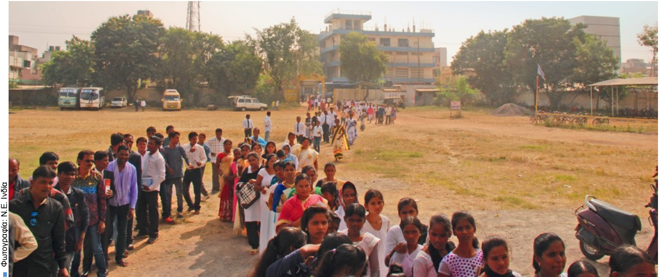
Φωτογραφία: Ν.Ε. Ινδία