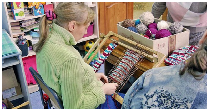
«Το νησί της ελπίδας», μια προσφορά προς πρόσωπα που έχουν σοβαρά μειονεκτήματα αλλά και ξεχωριστές ικανότητες.