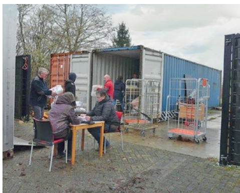
Εμπορευματοκιβώτια καθ' οδόν προς την Κεντρική Αμερική