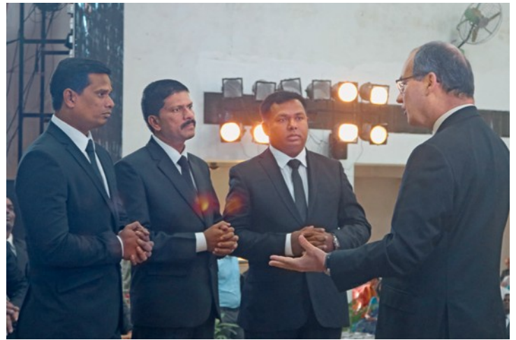
Ο Πρωταπόστολος Ζαν Λυκ Σνάιντερ χειροτονεί στο αποστολικό αξίωμα τους Devadas Basappa, Fred Charles Marihal και Prabhakar Beergi

Τι μπορεί να μας προστατέψει από αυτούς τους κινδύνους; «Κάνετε πράξη το καλό για τον πλησίον σας και να σέβεστε τις Εντολές. Εμμένετε στην αγάπη», είναι το κάλεσμα του Πρωταποστόλου Σνάιντερ: «Υπάρχουν πολλές καλές αιτίες για να μην αγαπάμε τον άλλον. Ωστόσο, δεν μπορούμε να κάνουμε διαφορετικά από το να αγαπάμε, επειδή η αγάπη του Θεού έχει διαχυθεί μέσα στις καρδιές μας, διαμέσου του Αγίου Πνεύματος. Πιστεύουμε στη νίκη της αγάπης. Αυτή είναι η πεποίθησή μας, αυτή είναι η πίστη μας».