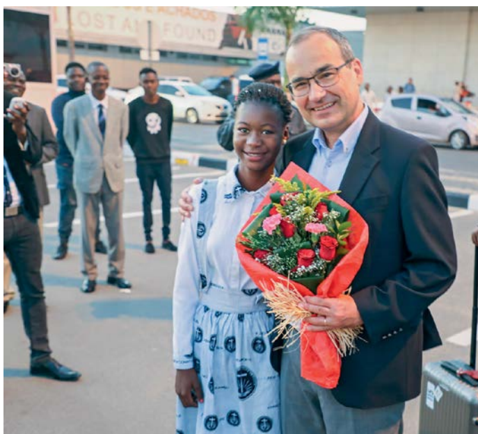
■ Φωτογραφία εξωφύλλου: Jonas Spengler ■ Φωτογραφία του Πρωταποστόλου: Hermann Bethke

ΝΕΟΑΠΟΣΤΟΛΙΚΗ ΕΚΚΛΗΣΙΑ ΚΥΠΡΟΥ Διονυσίου Κυκκότη 24 4043 Γερμασόγεια Λεμεσού Θεία λειτουργία, Κυριακή 10:00 π.μ.