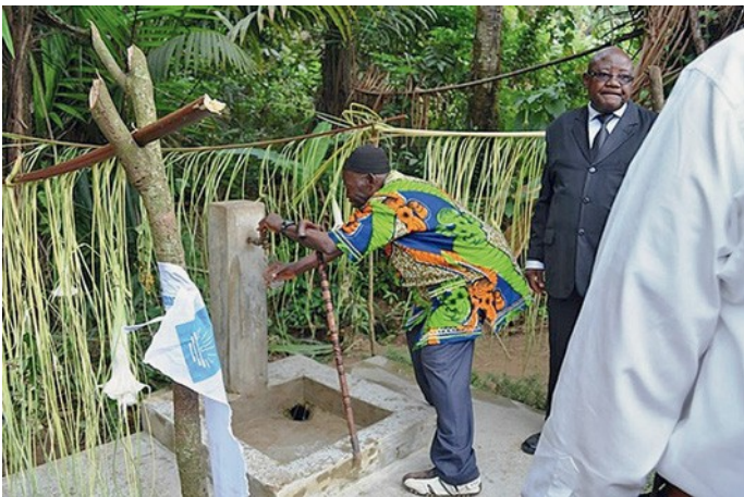
Κατασκευή πηγαδιών στο Μπενίν, στην Γκάνα και το Τόγκο – μια ζωτικής σημασίας βοήθεια για τους κατοίκους της Δυτικής Αφρικής

συνεργασία με τη Νεοαποστολική Εκκλησία του Βερολίνου-Βρανδεμβούργου.