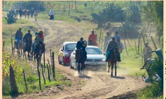
Φωτογραφία: Ν.Ε. Νότια Αφρική