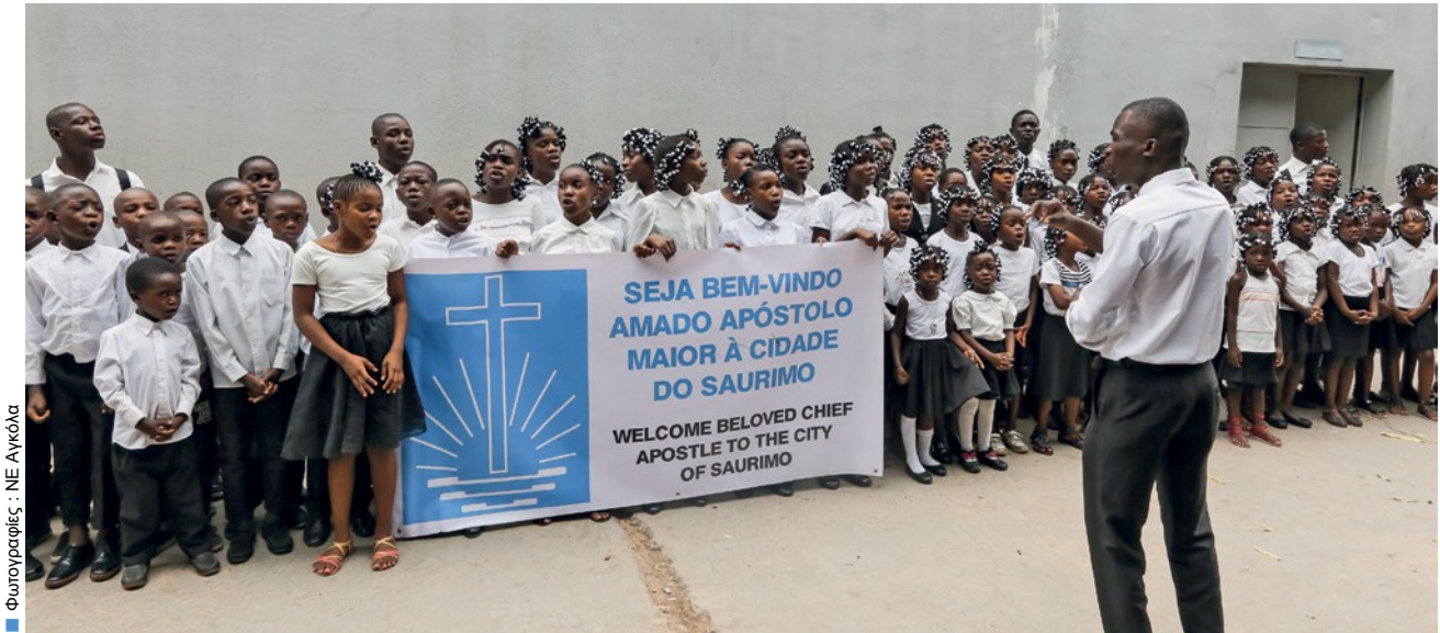
Φωτογραφίες: ΝΕ Αγκόλα