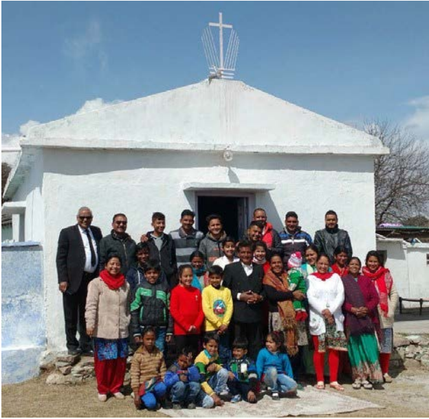
Ο αναπληρωτής Απόστολος Περιφέρειας Δαυϊδ Ντεβαραζ, καθ' οδόν για την τέλεση θείων λειτουργιών και συναντήσεις με τους αδελφούς και τις αδελφές