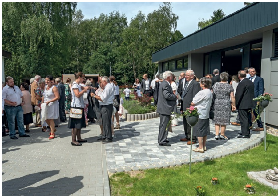
Η κοινότητα Ζέπερνικ απέκτησε μια νέα εκκλησία. Ο Πρωταπόστολος Σνάνιτερ την εγκαινίασε στις 30 Ιουλίου 2017. Την προηγούμενη ημέρα οι αδελφοί και οι αδελφές συγκεντρώθηκαν με την ευκαιρία μιας συναυλίας στην Εκκλησία.

Τότε η παράκληση να παραμένουμε στον οίκο του Κυρίου, εκφράζεται με συγκεκριμένα αιτήματα από τον Θεό: