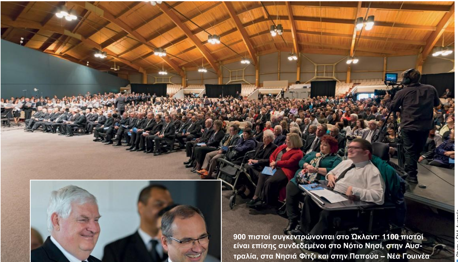
900 πιστοί συγκεντρώνονται στο Ωκλαντ· 1100 πιστοί είναι επίσης συνδεδεμένοι στο Νότιο Νησί, στην Αυστραλία, στα Νησιά Φίτζι και στην Παπούα – Νέα Γουινέα