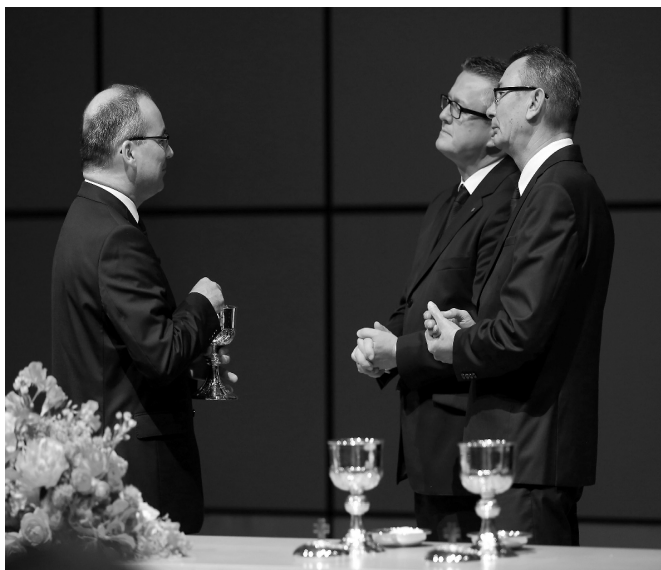
Umjesto pokojnih apostoli primaju Svetu večeru

A što govori meni, to govori i mnogim vjernicima. Nastojmo svoju zahvalnost prema Duhu Svetomu pokazati i time što uzimamo hranu koju on priprema.